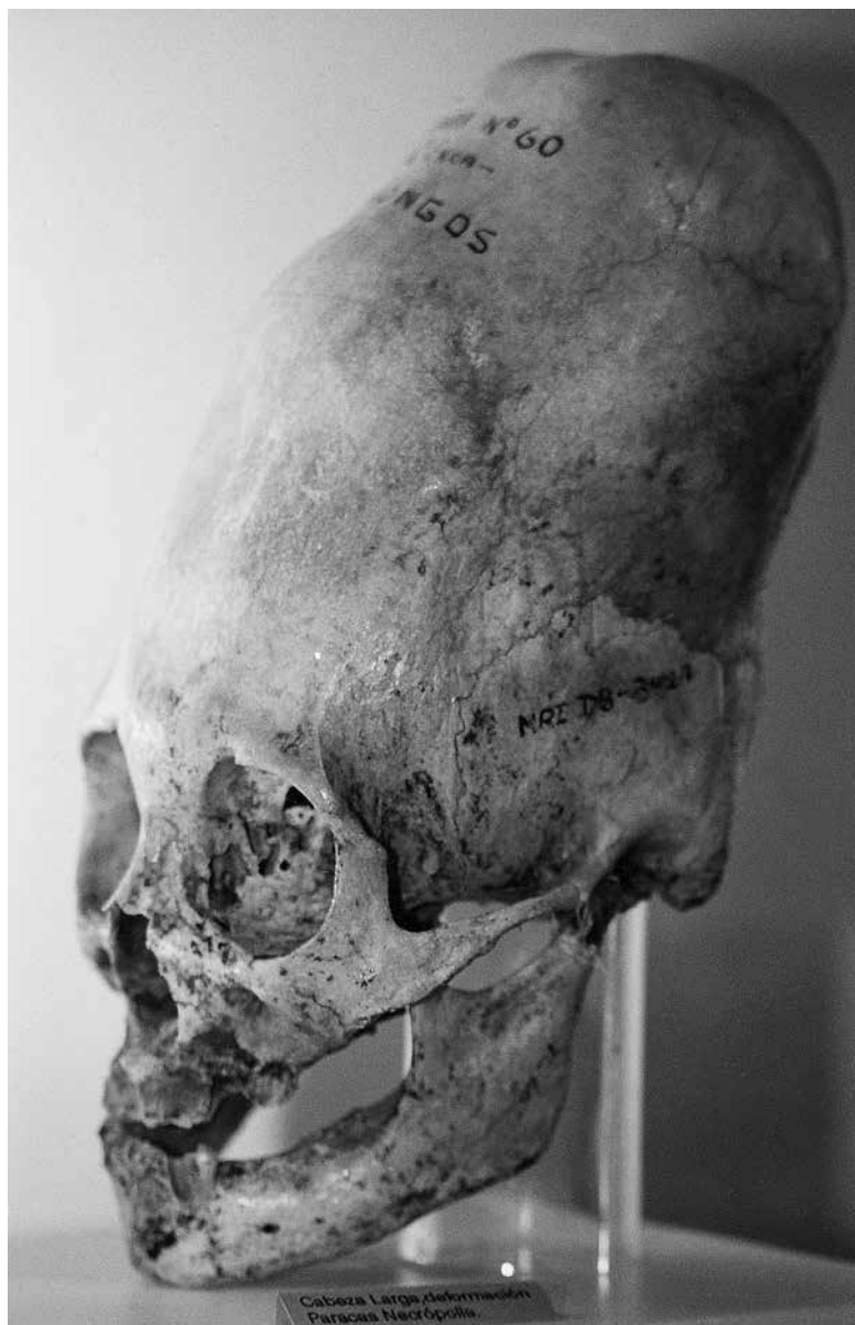
Některé lebky mají přímo gigantické rozměry.