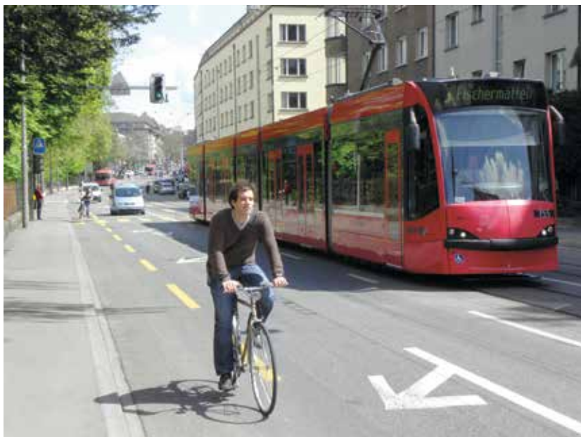
Cyklopruh ve Švýcarsku: příklad integrace cyklistické dopravy v provozu

provoz, nejsou ale dostatečně komfortní — podíl kola na dopravě tak dosahuje nizozemského průměru jen v několika málo menších městech.