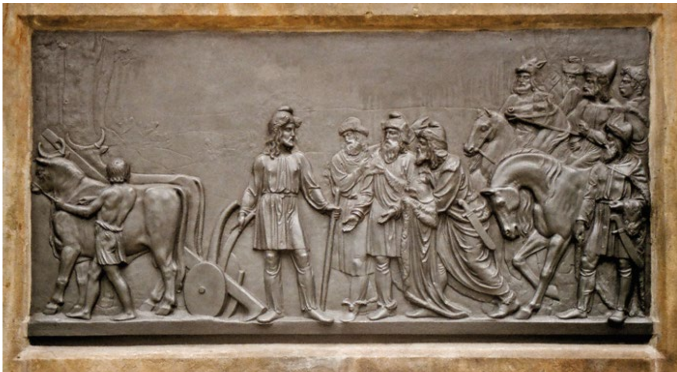
DETAIL RELIÉFU – POSELSTVO U PŘEMYSLA

chlapec vstříc i tázali se ho, řkouce: „Slyš, dobrý chlapče, jmenuje se tato ves Stadice? A jestliže ano, je v ní muž jménem Přemysl?“ – „Ano,“ odpověděl, „je to ves, kterou hledáte, a hle, muž Přemysl nedaleko na poli popohání voly, aby dílo, jež koná, hodně brzo dokonal.“ Poslové přistoupivše k němu pravili: „Blažený muži a kníže, jenž od bohů nám jsi byl zrozen, ... vypřáhní od pluhu voly, změň roucho a na koně vsedni! (...) Paní naše Libuše i všechen lid vzkazuje, abys brzy přišel a přijal panství, jež je tobě i tvým potomkům souzeno. Vše, co máme, i my sami jsme v tvých rukou; tebe za knížete, tebe za soudce, tebe za správce, tebe za ochránce, tebe jediného sobě volíme za pána.“