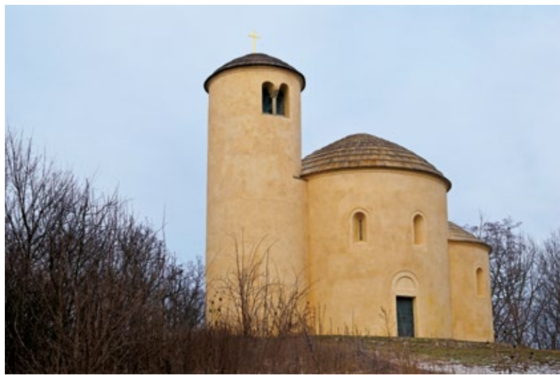
ROTUNDA SV. JIŘÍ

zemi zaslíbenou, je Kosmas nejstručnější: neví kdo, kdy, odkud a vlastně ani kam přišel (doslovně píše tuším kolem hory Řípu ). Zato Hájek prokázal svou beletristickou zdatnost – určí i datum, přesný počet lidí a spoustu jiných informací včetně jména Čechova bratra Lecha, který pak sehrál svou roli i v dalších pověstech (třeba o vzniku Kouřimi, ale někdy též při osídlení Polska Lechity). V tomto případě se řídil heslem: proč přiznávat nevědomy, věrohodněji přece působí přesné údaje – tak si je vymyslím. A nedosti na tom, ještě přibíjíme fiktivní praotcův pohřeb v Ctiněvsi pod Řípem (kde byl hrob později mnohokrát hledán!): Léta 661 od toho času, jakž jest všel Čech do země, léta sedmnáctého a věku svého osmdesátého šestého kníže Čech umřel... Třetího dne nesli jej málo od jeho přibýtku na západ slunce a na jedné pláni tělo jeho, všickni oupějice a křičíce, líbali a tak je pohřebili. Potom to místo a ten hrob po dlouhý čas navštěvující plakali a klaněli se, všelikou jemu činice poctivost [prokazující čest]. Po nedlouhém pak času na tom místě ves postavili a pro poctivost toho hrobu Ctiňoves jí jméno dali.