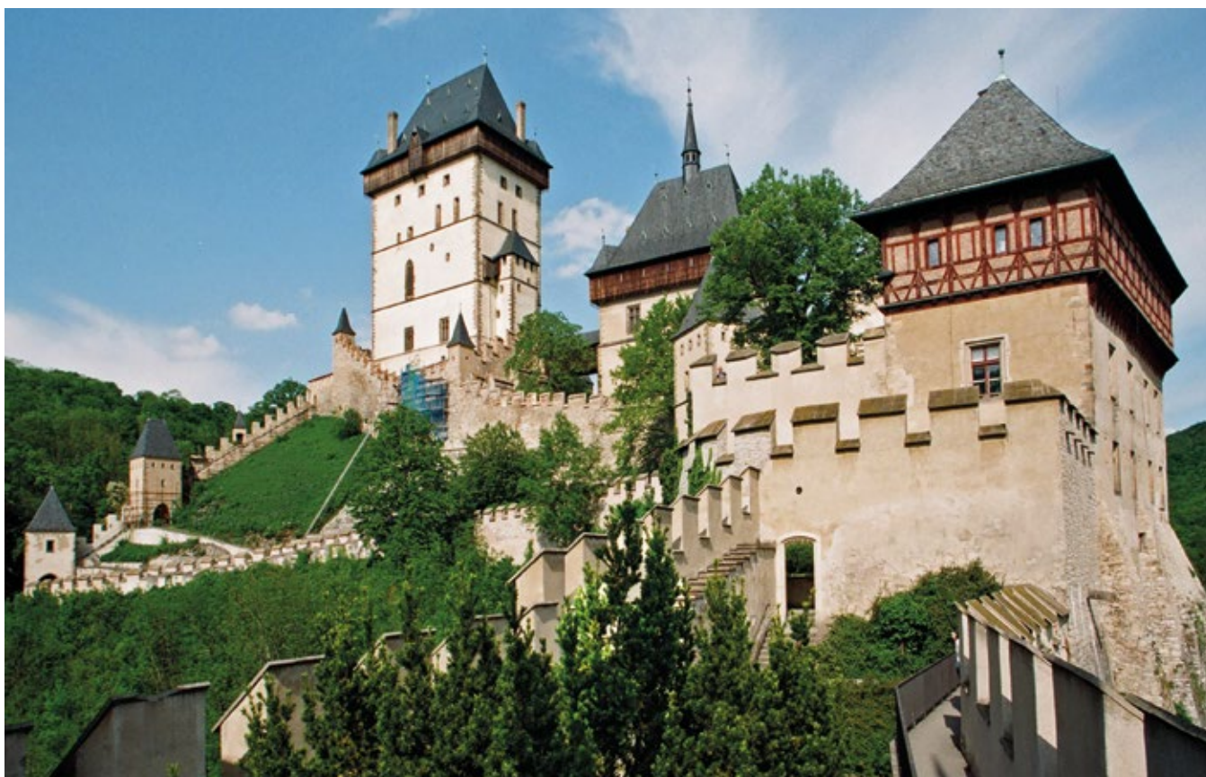
KARLŠTEJN, POHLED OD HRADNÍ STUDNY