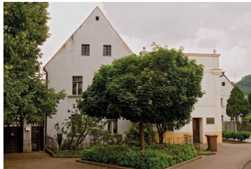
NÁPIS HLÁSÁ, ŽE ZDE STÁVAL „PŘEMYSLŮV STATEK“

Po celé věky byl ovšem mýtus velmi živý: Karel IV. svým privilegiem z r. 1359 osvobodil tři místní usedlosti od všech poddanských povinností s tím, že mají opatrovat posvátný lískový strom, jenž vyrazil z Přemyslovy otky (náčiní na odstraňování hlíny z pluhu), a ořechy dodávat na královský stůl. Privilegium potvrzovali panovníci i v dalších staletích, plody ze stadické lísky obohacovaly královské tabule prokazatelně až do r. 1701 a možná svou roli plnily i během korunovacích (několikrát máme doloženo sypání lískových oříšků před krále).