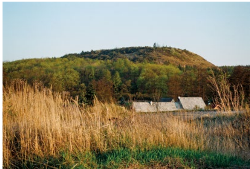
RUBÍN U PODBOŘAN

Problém lokalizace Wogastisburgu je neoddělitelný od stavu poznání toho útvaru, jež jsme si navykli nazývat Sámovou říší. Se slovem „říše“ ale zacházejme opatrně – evidentně se jedná o předstátní útvar, velký kmenový