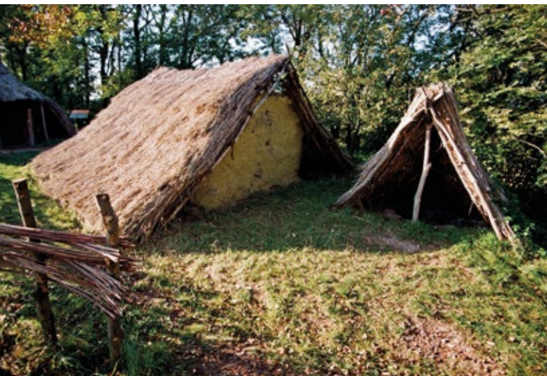
BŘEZNO U LOUN – ARCHEOLOGICKÝ SKANZEN

Vinidové sloužili již odedávna jako befulkové Hunům [Avarům], takže kdykoli Hunové vojensky útočili na některý národ, stáli Hunové s celým svým vojskem před táborem, Vinidové pak bojovali; jestliže nabývali vrchu a vítězili, tu Hunové vyrazili, aby se zmocnili kořisti, jestliže však byli Vinidové přemáháni, opírali se o pomoc Hunů a tak nabývali nových sil. Befulky je Hunové nazývali proto, poněvadž postupovali před Huny, tvoříce v bitvě dvojité šik. Hunové přicházeli každoročně k Slovanům přezimovat, brali si do lože manželky Slovanů i jejich dcery. – Na scénu vstupuje Sámó ve chvíli, kdy se ukáže být nepostradatelným pro Slovaný bojující proti nadvládě kočovných Avarů.