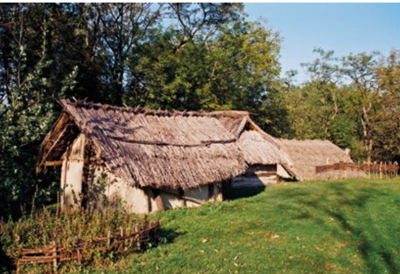
SKANZEN V BŘEZNĚ

dva byly úspěšné, rozhodující Dagobertův utrpěl zdrcující porážku v „třídenní bitvě“. Tu si představujeme nejspíš jako tři dny opakovaných pokusů o dobytí pevnosti než jako nepřetržitý, soustavný boj. Poté Fredegar jen drobnými zmínkami na dalších místech kroniky doplňuje, že Slované se uhájili natrvalo, navíc se ke spolenectví se Sámem přiklonily další kmeny: Dervan, vévoda národa Srbů, kteří byli z rodu Slovanů a již dávno patřili ke království Franků, přidal se se svými lidmi ke království Sámovu.