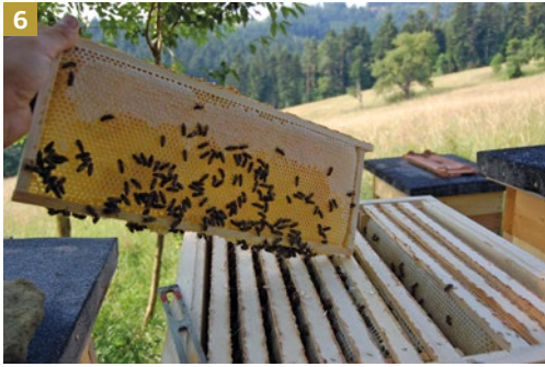
6 Med uložený ve vystavěných mezistěnách