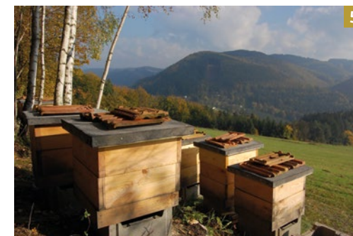
Včelnice na Valašsku, 2010