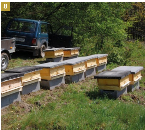
8 Nová včelnice

livé populace roztočů a hygienické chování včel. Při ošetřování včelstev proti roztočům jsem omezoval množství používaných syntetických chemických přípravků a experimentoval s organickými látkami. Čistotu a pohodu včelstev, ale také kvalitu medu, jsem podporoval vlastní výrobou mezistěn (obr. 6). Počet mých včelstev překročil číslo 150 a prosperitu provozu zajišťoval přísun kvalitního medu z čisté krajiny a dobrý marketing. Následovalo období všeobecného nadšení mezi včelstvy, zákazníky a včelařem. Poblíž včelařství jsem zřídil včelařskou naučnou stezku, kde se uplatnily mé první kresby s touto tematikou. Pořádal jsem komponované prohlídky s výkladem o včelách v krajině, o včelích produktech a jejich využití pro své zákazníky, žáky z okolních škol, skupiny včelařů, zájezdy důchodců. Přibývalo také fotografií o včelách, které plnily webové stránky mého včelařství. Vlastním nákladem jsem vydal brožurky pro včelaře začátečníky. Bylo to období plně krásné a smysluplné práce (nebo to tak alespoň vypadalo).