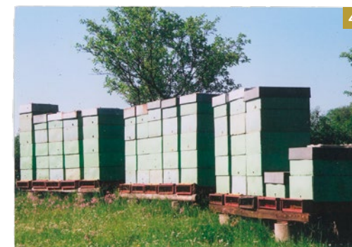
Vysoké úly v době masového pěstování řepky, 2003