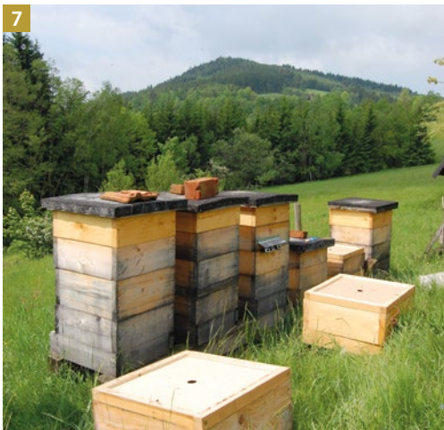
7 Tvorba oddělků