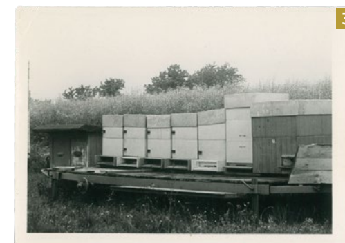
Jarní rozvoj včelstev u tehdy vzácné řepky, 1970

Sám jsem začal včelařit až po založení rodiny, na Valašsku. Začal jsem vyrábět jednoduché celodřevěné nízké nástavky s rámkovou mírou „Optimal“ 42 × 17 cm a zakládal malé včelnice (cca po 15 produkčních včelstvech) v nadmořské výšce kolem 600 m n. m. v bohaté nezemědělské krajině hřebenových partií Vsetínských vrchů (obr. 5, 7, 8). Po dosažení počtu asi sta včelstev jsem začal zjednodušovat obsluhu včelnic, a tak jsem převedl včelařství na kombinovanou metodu typu Dadant (obr. 9). Včelám tento zásah vyhovuje, jarní rozvoj je na vysokém rámku v plodišti rychlejší a práce s medníky jednodušší. Ve včelařství jsem testoval různé chovné matky, své i cizí. Sledoval jsem proměn-