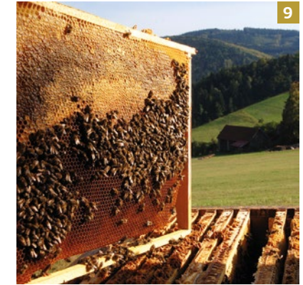
9 Kombinovaná metoda typu Dadant

Přistupujme k našim úlům s úctou, neboť společenstva uvnitř mají daleko hlubší historii, než má naše lidská společnost. A tak i já se v nové etapě svého včelaření přikláním k cestám kopírujícím postupy v přírodě. Když se například přemnoží roztoči v hnízdě včely východní, včely hnízdo opustí a nechají uhynout roztoče v buňkách s opuštěným plodem. Nám se nabízí přemetení včelstva na mezistěny a likvidace napadeného plodu. Je to opatření s účinností téměř 90%, a to bez jediné kapky chemie. A existuje spousta dalších pohledů a podnětů, které najdete i na následujících stranách knížky.