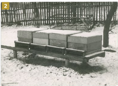
Zimování včelstev na jednom nástavku

kteřá vyžadovala jiný přístup a hlavně větší prostor v úlu. Začali zimovali svá včelstva na dvou až třech nástavcích a jaro probíhalo ve znamení přehazování nástavků, které ve většině případů vedlo k masovému rojení včelstev (o zebrování nebo nárazníkovém pásmu tehdy nikdo nic neslyšel). Včelstva na snadnou snůšku z řepky reagovala zvětšením své velikosti. Úly v době kvetení řepky dosahovaly velikosti šesti i více nástavků. Nástavky s devíti rámkami začaly být malé pro včelstvo a nepohodlné pro včelaře (obr. 4). Změnu k lepšímu přinesl postupný přechod na nízké nástavky úlové sestavy „Optimal“, ale práci rodičů začala brzdit ubývající energie nezvratného stáří a neochota vpustit na včelnicu svou vlastní mladou nastupující včelařskou generaci. Překrývání generací pracujících dělnic je přitom jedním ze základních pilířů společenského chování včel, nikoli však asi včelařů.