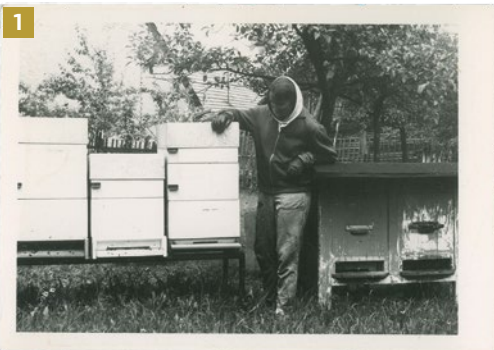
Zavádění nástavkových úlů, 1970

k mé současné hrůze, vydržely skoro 40 let). V zimě se doma v koupelně vyráběly mezistěny a ve sklepě řadové bytovky byla improvizovaná prodejna medu. Když byl dobrý rok, mohli si za roční produkci medu koupit nové a na svou dobu luxusní auto. Jejich včelařská metoda byla velmi intenzivní, založená na malém, mateří mřížkou odděleném plodišti, odkud každý devátý den převěšovali zavíčkovaný plod do medníku a do plodiště vkládali prázdné plásky nebo mezistěny. Plodování matky bylo normovaně kontrolováno na omezeném prostoru. Tato metoda měla velkou efektivitu v získávání medu, ale velkou časovou náročnost. Rodiče v té době zimovali svá včelstva jen na jednom nástavku (obr. 2). Jarní rozvoj včelstev často podporovali kočováním do sadů ovocných stromů v nížině, popřípadě k (v té době) ojedinelým polím řepky, kde rozšířili včelstvo na dva nástavky (obr. 3). V průběhu léta včelstva dosahovala své maximální velikosti ve třech nástavcích. Konec ve využívání této metody přineslo rozšiřující se pěstování řepky po roce 2000 a překotná jarní snůška,