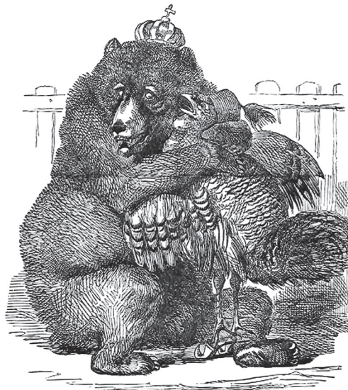
Turecký krocan v objetí ruského medvěda

Nejdříve vysvětlil car svůj postoj k francouzskému králi těmito slovy: „Ludvík Filip je pro Evropu požehnáním, s tím upřímně souhlasím. Ale já nikdy nebudu jeho přítelem... Vždyť aby si získal svou pozici a udržel se v ní, pokusil se podkopat naopak mou jako ruského vládce a to mu nikdy nezapomenu.“