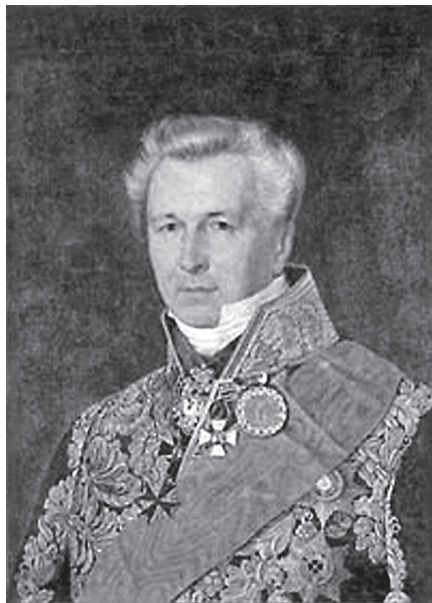
Ruský vyslanec u britského královského dvora R. Brunnov

Vraťme se o pár let zpět. Jen deset minut chybělo do desáté hodiny v sobotu 1. června 1844 a nad Temží zavlály vlajky s černým dvojhlavým orlem. Jeho imperátorská Výsost, car všech Rusů Mikuláš I., právě dorazil na návštěvu své sestřenice, Její královské Výsosti královny Viktorie, královny Spojeného království Velké Británie a Irska.