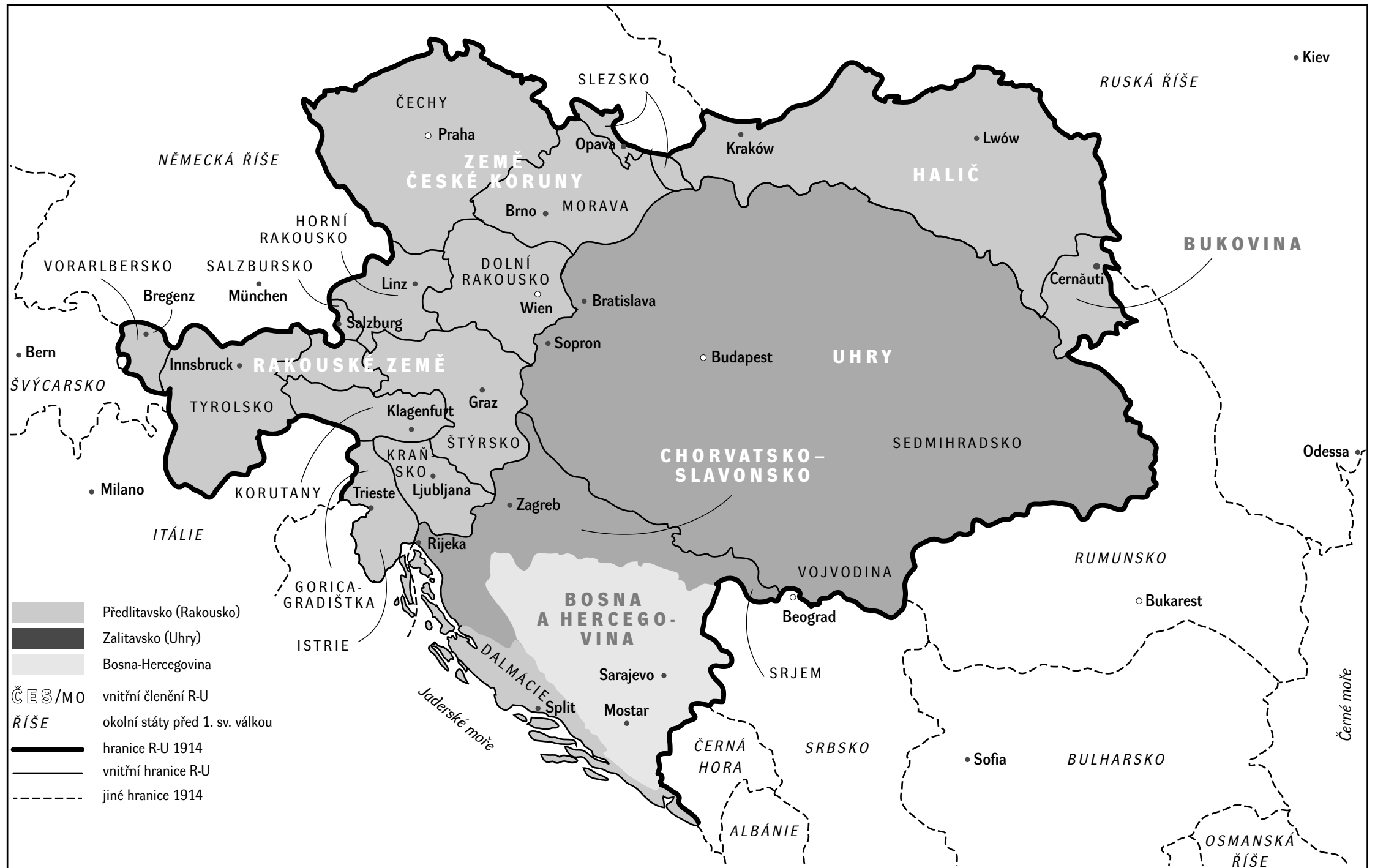
Rakousko-Uhersko před první světovou válkou