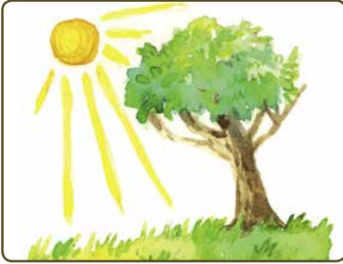
A SUNNY DAY