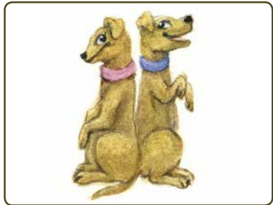
A SISTER AND A BROTHER