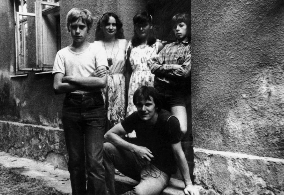
Tajná chaloupka v Koryčanech, 1981

Brno, pracoval jsem na stavbě silnice v Brně Kohoutovicích. Tam jsem zůstal až do vojny a bylo to krásné.