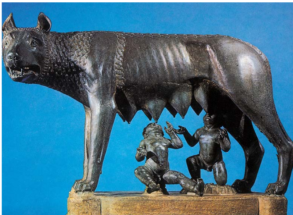
Kapitolská vlčica z bronzu. Etruská práca z 5. stor. pred n. l. Museo Capitolino, Rím

Tu sa dostávame k jednému z najznámejších príbehov rímskej mytológie, ktorý má mnoho obdôb v starších aj v novších časoch: u kráľa Sargona Akkadského v babylonských mýtoch, u Mojžiša v židovských, u Kýra v perzských, u kráľa Ječmínka v českých. Len čo sa totiž Amulius dozvedel o narodení eventuálnych uchádzačov o svoj trón, rozkázal ich hodiť do rieky; rovnaký rozkaz vydal aj ohľadne Rey Silvie. Sluhovia dali chlapcov do koša a odniesli ich k Tiberu, ktorý bol práve rozvodnený. Položili koš na vodu a ohlásili Amuliovi splnenie rozkazu. Voda však čoskoro opadla