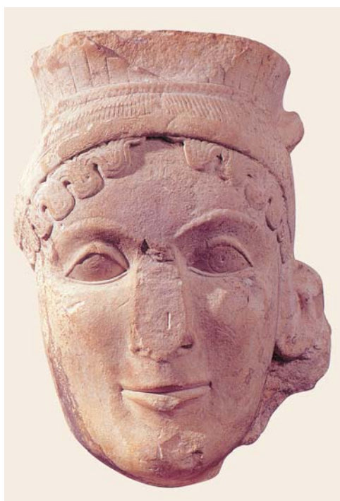
Bohyňa Juno, Jupiterova manželka

moc bohov; museli si ich nakloniť zmierlivosťou. Menelaos sa teda vypravil na radu svojho brata, mykénskeho kráľa Agamemnóna, do Tróje, aby ukázal dobrú vôľu a poskytol kráľovi Priamovi možnosť vybaviť vec po dobrom. Pre všetky prípady si vzal so sebou ešte aj obratného vyjednávača, itackého kráľa Ulixa čiže Odysea. Dopadlo to podľa očakávania: Paris odmietol o Helene čo i len hovoriť a chcel vrátiť iba po-