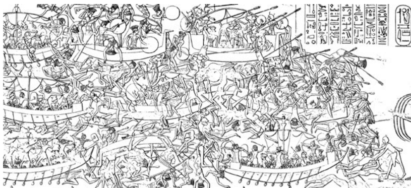
Námořní bitva s Mořskými národy v Medínit Habu

Třebaže o původu ani motivech nájezdníků nevíme nic, víme, jak vypadali – jejich jména a tváře vidíme vytesané do stěn zádušního chrámu Ramesse III. v Medínit Habu. Je to místo plné obrazů a impozantních hieroglyfických textů. Na vyobrazeních jasně vidíme výzbroj, zbraně, oděvy a lodě nájezdníků, jejich volské potahy naložené majetkem. Obrazy jsou tak podrobné, že vědci publikovali analýzy jednotlivých národů, a dokonce i jednotlivých lodí, jež jsou na scénách zachyceny. 11 Další panoramata jsou ještě barvitější. Jedno z nich ukazuje cizince a Egyptany v chaotické námořní bitvě; někteří plavou nznak a jsou zjevně mrtví, zatímco další divoce bojují na lodích.