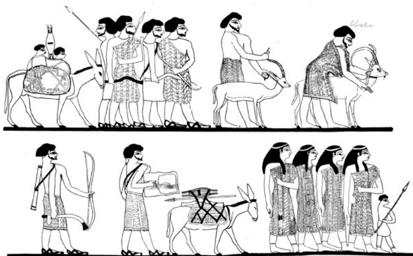
„Asiaté“ v Bení Hasan

na mnohem delší vzdálenost než tehdejší tradiční luky. Měli také vozy tažené koňmi, do té doby v Egyptě nevídané.