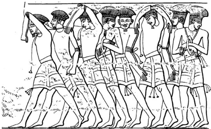
Příslušníci Mořských národů, zobrazení jako zajatci v Medínit Habu

Ramesse na stěnách svého zádušního chrámu v Medínit Habu nedaleko Údolí králů výstižně uvádí: