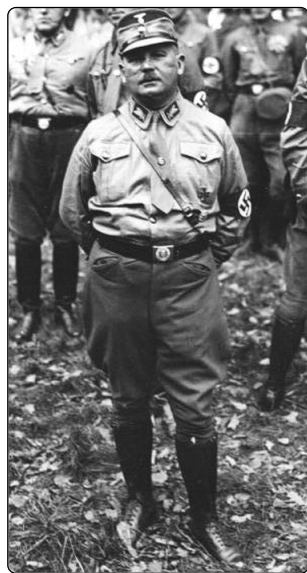
Ernst Julius Röhm, Hitlerův přítel, zakladatel a velitel nacistických SA, byl po tzv. Noci dlouhých nožů bez soudu zastřelen ve vězeňské cele.

Tak se v létě roku 1934 v Německu zrodil puč, jenž vešel do dějin pod označením „Noc dlouhých nožů“. Po fyzické likvidaci Ernsta Röhma a dalších Hitlerovi nepohodlných