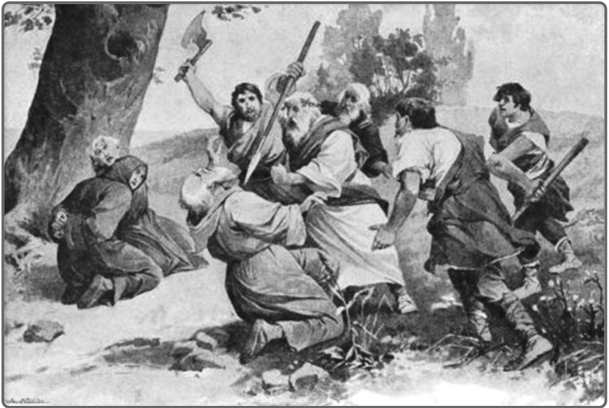
Zavraždění biskupa Vojtěcha na jeho misionářské cestě v pohanském Prusku (obraz Věnceslava Černého).

Tento německý panovník byl totiž vzdělaný, zbožný a okamžitě poznal, že má před sebou stejně vzdělaného, a navíc moudrého muže, s nímž mohl otevřeně diskutovat o čemkoli – o církevních otázkách i politice. Vojtěcha se od jeho rozhodnutí působit mezi pohanskými Prusy snažil přemluvit, neboť o nich kolovaly zvěsti, že s křesťany nemají slitování, ale biskup už byl rozhodnutý. Půjde právě tam, ať už se stane cokoli.