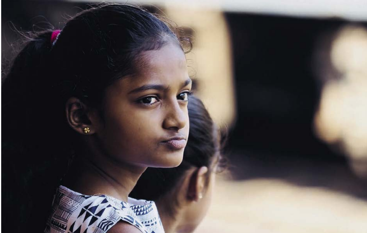
▲ Na nádraží v Galle