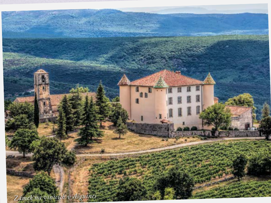
Zámek na vinicích v Aiguines

Provence se tak stala místem, kde vznikaly a mísily se tehdejší trendy. Ale přispěla i k jejich určování, a to právě díky svým tradicím a jedinečným produktům, které si díky exportu získaly světový věhlas. Zároveň ale neztratila nic ze své ryzosti a zemitosti, typické pro venkovské části. Zde touto dobou stále valná většina venkovského obyvatelstva hovořila provensálštinou, dialektem