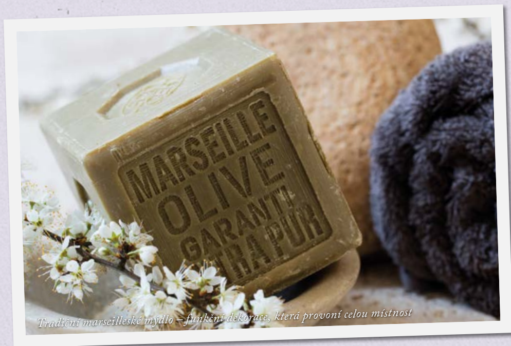
Tradiční marseilleské mýdlo – funkční dekorace, která provoní celou místnost

Dostatek olivovníků i rostlin pro výrobu aromatických olejů předurčil Provence pro roli mýdlové velmoci, jejímž centrem se stala Marseille. Pro typické masivní krychle mýdla v přírodních barvách a s opojnými vůněmi olivovníku, levandule, jasmínu či pomeranče jsou typické nápisy (značky či informace o složení) vyraženy pomocí speciálních kovových raznic. Jsou krásnou dekorací do koupelny či ložnice a plní i funkci interiérové vůně.