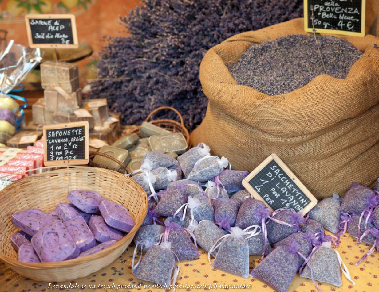
Levandule se na trzích prodává ve všech představitelných variantách