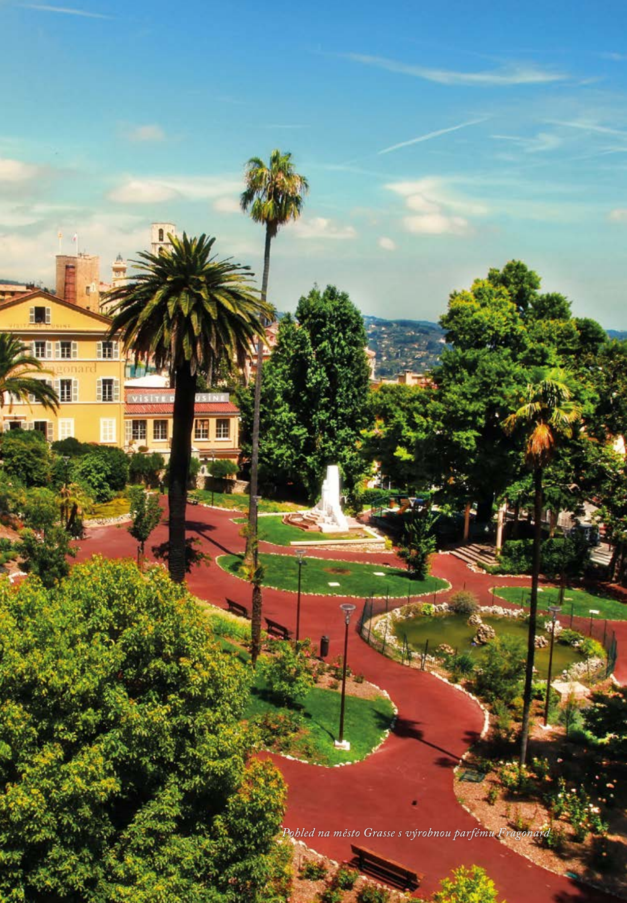
Pohled na město Grasse s výrobnu parfému Fragonard