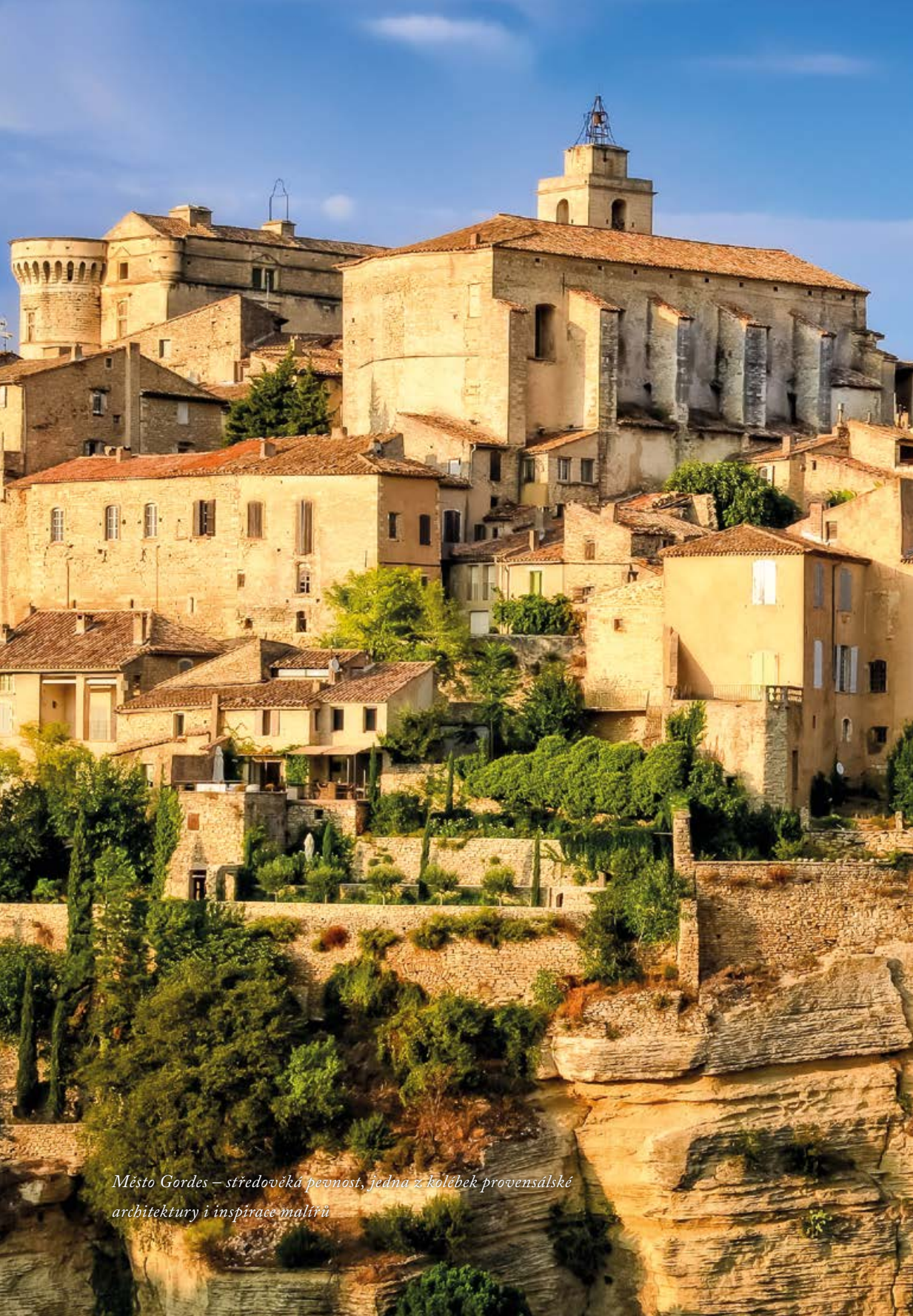
Město Gordes – středověká pevnost, jedna z kolébek provensálské architektury i inspirace malířů