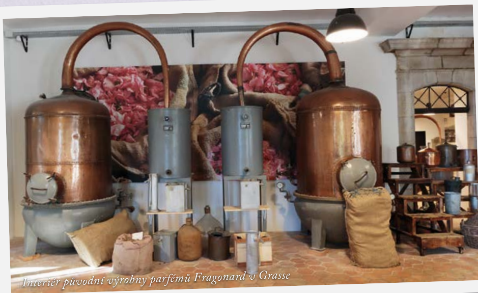
Interiér původní výroby parfémů Fragonard v Grasse

Při výletu do Grasse stačí jediné: vnímat barvy a struktury domů, které tvoří zdejší uličky, inspirovat se nezaměnitelnými interiéry zdejších obchodů a především doslova nasávat zdejší atmosféru. Město je obklopeno poli a zahradami, vonícími levandulí, myrtou, jasmínem, růží, mimózou, květem pomerančovníku a dalšími bylinami, které dohromady tvoří opojné kombinace vůní – a to i včetně těch interiérových. Není snadnější způsob než si do svého bytu přenést atmosféru Provence – o mnoho sofistikovanější, než je „pouhá“ vůně levandule, ale o nic méně autentickou.