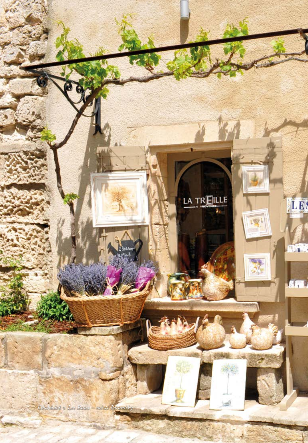
Obchůdek v Les Baux – město keramiky