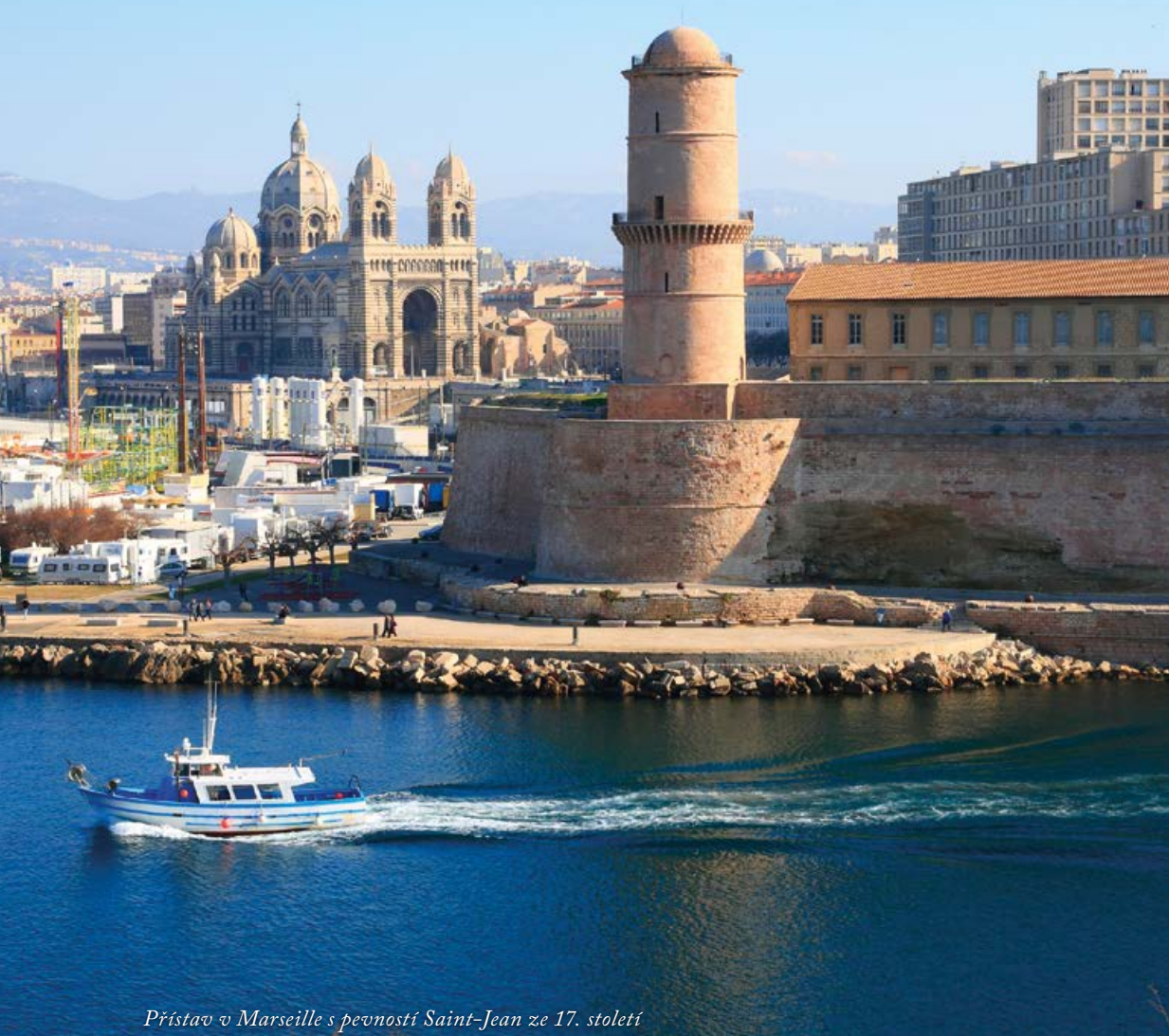
Přístav v Marseille s pevností Saint-Jean ze 17. století

byly olivový olej a parfémy, ale i tradiční výšivky boutis , fajánsová keramika nebo tkané látky. Brzy získal region pověst ráje na zemi. I díky přistěhovalcům z italského Piemontu a Ligurie měla Marseille na konci 18. století 120 tisíc obyvatel. Stala se třetím největším francouzským městem.