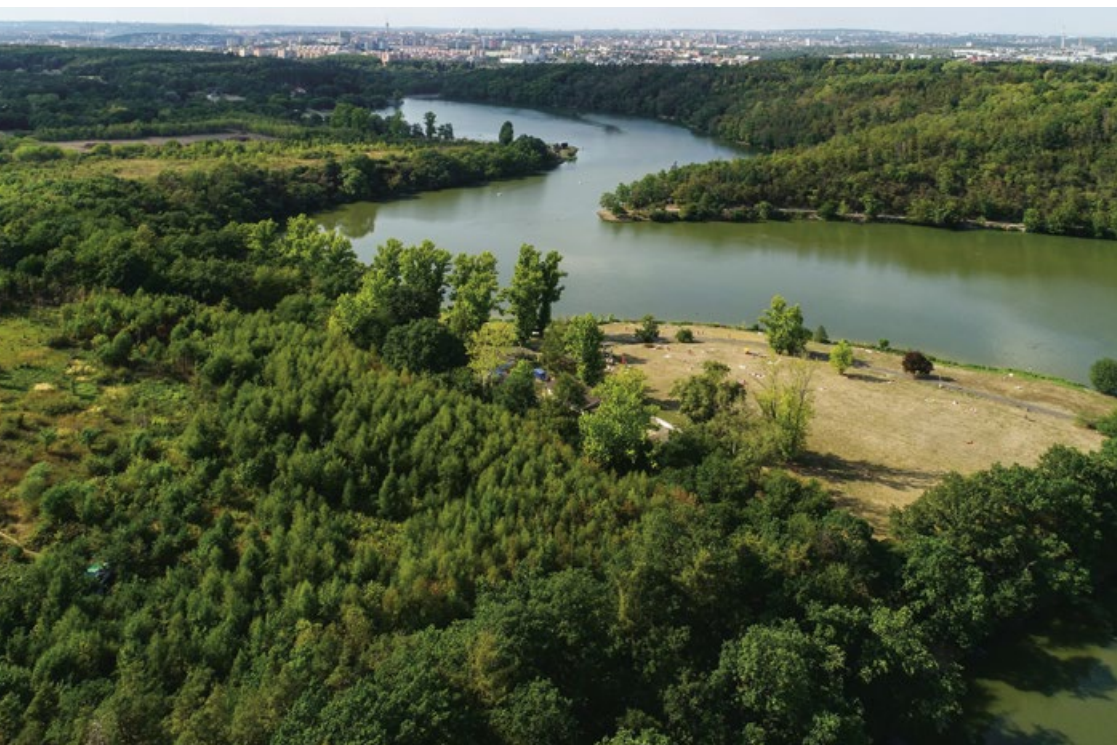
Botič je po Vltavě nejvýznamnější pražský vodní tok o délce 33,5 km a s rozlohou povodí 135 km 2