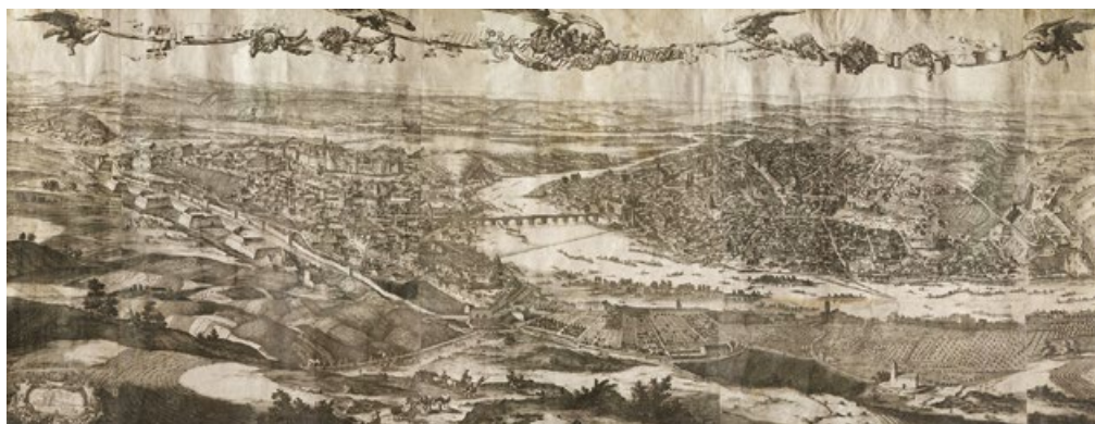
Pohled na Prahu v barokních hradbách z výšin nad Smíchovem. V popředí vlevo Petřín s Hladovou zdí a Újezdská brána, vpravo kostel sv. Filipa a Jakuba na Smíchově, dále vidíme zleva Strahovský klášter, Hrad, Karlův most, Střelecký ostrov, Staré Město, Nové Město, Vyšehrad, ale i okolí: dnešní Břevnov, Libeň, Karlín, Žižkov, Vinohrady, Pankrác, Krč a Smíchov