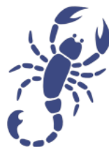
Štír 23. října – 21. listopadu