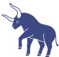
Býk 21. dubna – 21. května