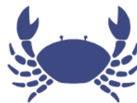
Rak 22. června – 22. července