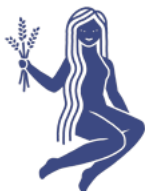
Panna 24. srpna – 22. září