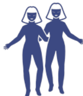
Blíženci 22. května – 21. června