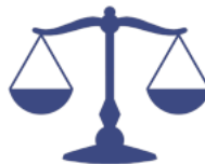
Váhy 23. září – 22. října