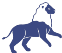
Lev 23. července – 23. srpna