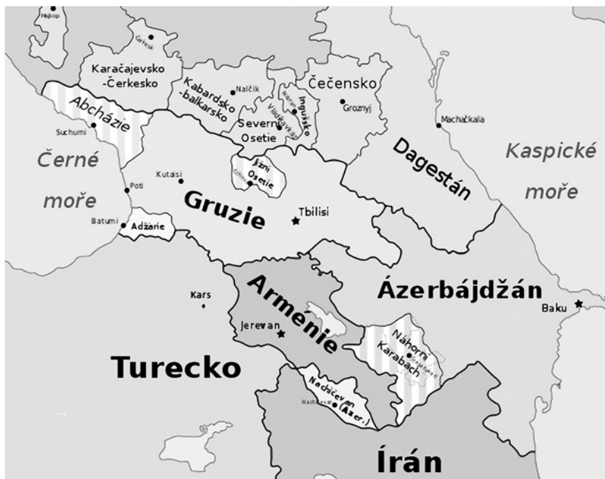
Politické rozdělení Kavkazu

Centrální část Kavkazu leží na území Gruzie (včetně Jižní Osetie) a dvou republik Ruské federace, Kabardsko-Balkarska a Severní Osetie. Na východě je vymezena sopečným vulkánem Kazbekem, zatímco