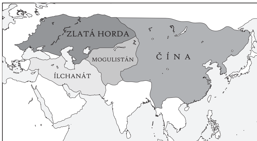
Rozdělení Mongolské říše a přibližný rozsah panství Zlaté hordy

Ve 13. století se přes jednotlivá ruská knížectví převalily dvě vlny skvěle vycvičených a disciplinovaných nomádských bojovníků. Této síle nedokázaly vzdorovat ani vyspělejší útvary, jako Čína, nebo Chorezm (Persie). Mongolská expanze započala roku 1206, kdy se Čingischán