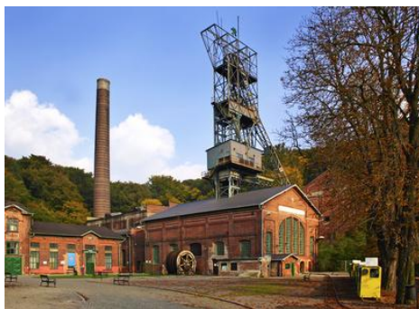
Hornické muzeum a Lanek Park na Landeku.

Na severozápadním okraji Ostravy, nad soutokem řek Odry a Ostravice, se táhne výrazný zalesněný vrch Landek 280 m. n. m., který je výraznou krajinnou dominantou.