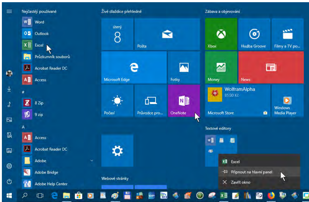
Obrázek 1.2: Spouštění aplikací Office z panelu Start

Pokud by již aplikace byla spuštěna (člověk se občas splete), zpřístupní se otevřené okno jednoho z otevřených dokumentů.