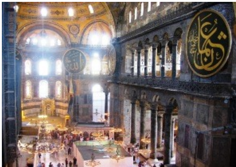
Pohled z galerie