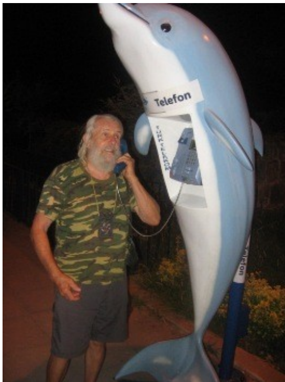
Autor se ptá delfína, kde Skaláci jsou