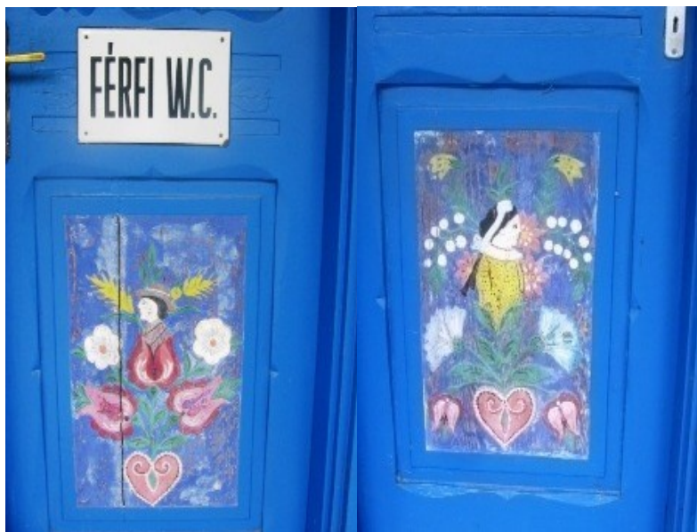
Pánské a dámské WC

Z Kalosci jsem odjížděl spokojený. Byl čas už na oběd, tak jsem zastavil v jednom lesíku. Vytáhl jsem malý horolezecký vaříč a uvařil si napřed instantní krevetou polívku a pak, když jsem ještě v Hungarii, tak jsem si ohřál konzervu maďarského guláše. Spláchnul jsem ho plechovkáčem.