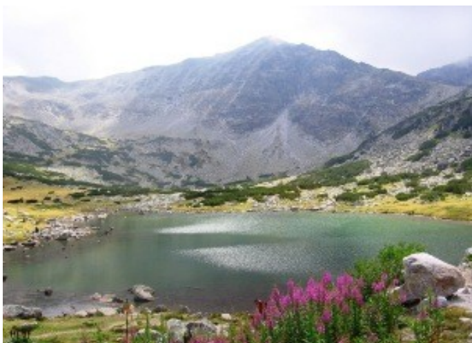
Musala 2925 m

U prvního jezírka jsem udělal konečnou. Na vyvýšeném břehu u zdejší horské chaty stál stůl s lavicemi, tady jsem se uvelebil. Vrchol Musaly s jejími skalními a suťovými svahy jsem měl před sebou jako na dlani. Ohřál jsem si lečo a při popíjení plechovkáče jsem zavolal přítelkyni, protože je to poslední lacinější volání z EU. Když jsem jí popsal velehorskou krásu, zmínil jsem příhodu s pruhou ruksaku. Z Prahy zazněl smích: „Asi ti narostla ještě ramena!“