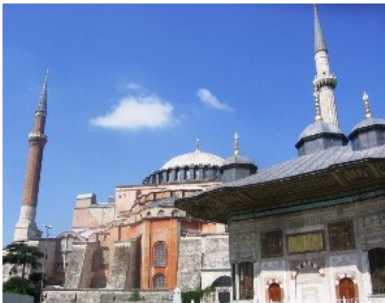
Ayasofya alias Hagia Sofia

Bývalá bazilika Ayasofya z 6. stol., dnes tedy Hagia Sofia, je obrovská. Dá se v ní zajít i do ochozů patrové galerie, odkud prostora chrámu teprve patřičně vynikne. V přízemních katakombách je vidět malé cihličky, pocházející z byzantské doby. Navíc jsou tu i křesťanské fresky, které při přestavbě na mešitu nebyly zničeny, ale pouze zatřeny vápnem. Islám jakékoliv zobrazování zakazuje, ale tady udělil aspoň vápenný pardon. Dneska je zpodobnění Ježíše Krista a Matky boží odkryto.