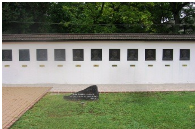
Pamětní prostranství rodiště Petőfiho

s ruským vojskem. Předzvěst roku 1956, kdy sovětská vojska rozdrtila tanky v Budapešti tehdejší maďarskou revoluci?