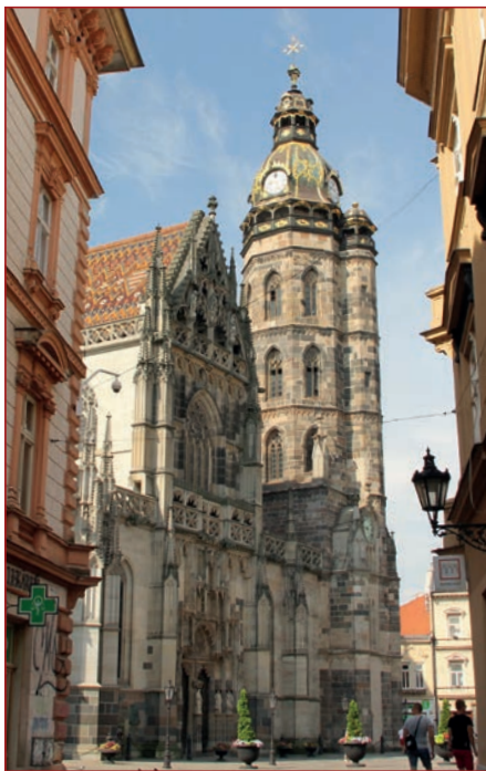
Dóm sv. Alžbety v Košiciach