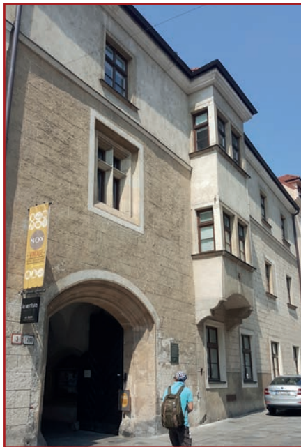
Budova Academie Istropolitany

Na začiatku 70. rokov 15. storočia vyvrcholila v Uhorsku vnútropolitická kríza, ktorej dôsledkom bolo sprisahanie proti Matejovi Korvínovi. Do sprisahania bol zapletený aj hlavný prorektor Academie Istropolitany, kancelár a arcibiskup Ján Vitéz. Kráľ ho dal zatknúť a Ján Vitéz roku 1672 zomrel. Tým sa začal aj úpadok univerzity. Regiomontanus sa rozhodol Uhorsko opustiť, no ešte predtým venoval kráľovi Matejovi svoje astronomické dielo Tabulae primi mobilis (Tabuľky primárnych pohybov). Usadil sa v Norimbergu, kde ako vlastník jednej z prvých európskych tlačiarň vydával matematické a astronomické spisy. Vydal Deutscher Kalender (na roky 1475 – 1530), v ktorom bolo veľa astronomických údajov, ale predvídal tam aj zmenu juliánskeho kalendára. Regiomontanov koniec bol veľmi nečakaný. Pápež ho pozval do Ríma a smrť ho tam zastihla ako 40-ročného v lete roku 1476. Po Regiomontanovi je pomenovaný lunárny kráter, asteroid a dokonca aj astronomický časopis Der Regiomontanusbote .