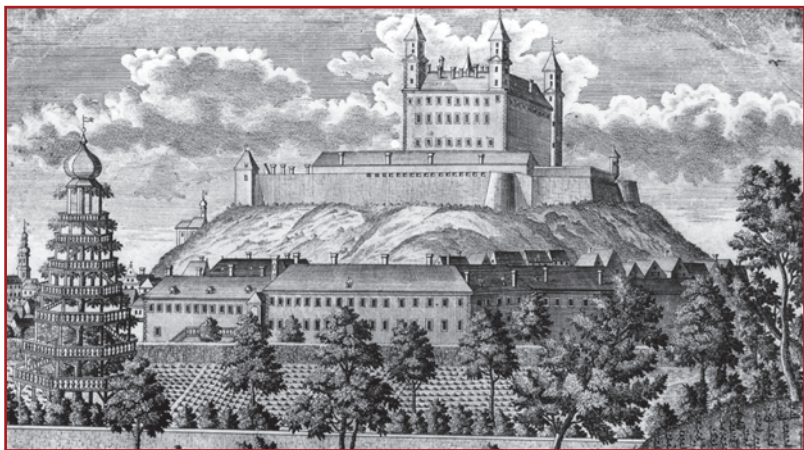
Rodiskom sv. Alžbety bol Bratislavský hrad

sa tešil z každého jej úsmevu. Bolo jasné, že mladý pár sa miluje, hoci ich sobáš dohovorili bez toho, aby sa mladomanželia v čase zasnub sotva mohli vzhľadom na vek vidieť. Bolo to šťastné manželstvo a narodili sa z neho tri deti. Najstarší bol syn Herman, pokračovateľ rodu. Potom prišli na svet dve dievčatá Sofia a Gertrúda. Sofia sa stala príslušníčkou šľachty a Gertrúda dala prednosť životu v kláštore a v cirkvi je oslavovaná ako blahoslavená. Alžbetina dobrá duša a almužny, ktoré rozdávala chudá-