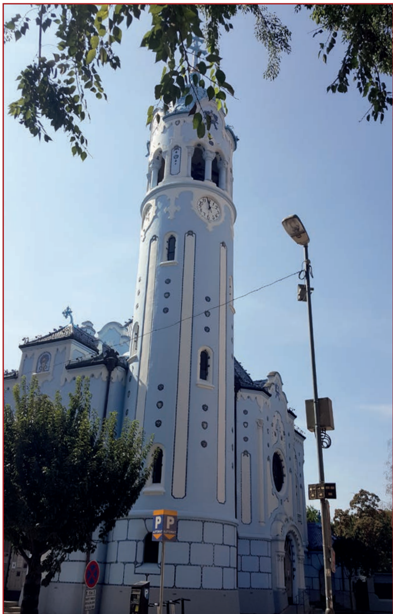
Modrý kostolík krátko po jeho dostavani