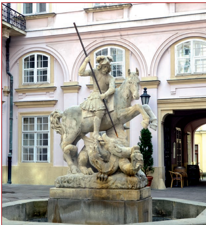
Socha sv. Juraja dnes stojí na nádvorí Primaciálneho paláca