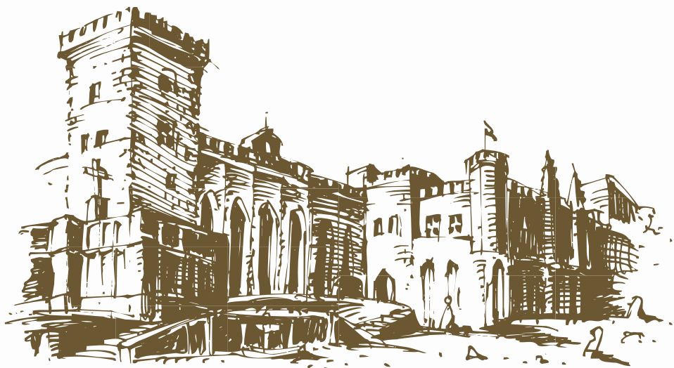
■ Papežský palác v Avignonu ještě dnes působí jako „vězení“.

Hned od začátku ne důvěřovali novému papeži Italové, kteří v něm viděli pouhou Filipovu loutku. Toto podezření výmluvně dokazovala skutečnost, že nový papež nikdy nevstoupil do Říma, ani si za své místo nevybral alespoň území papežských států. V roce 1308 dokonce „rozhodl“, že se papežská kurie usídí v Avignonu v Provence, v těsné blízkosti tehdejších hranic Francouzského království, a v roce 1309 zde nechal vybudovat opevněné sídlo (toto tzv. „avignonské zajetí“ papežů pak trvalo 70 let). Klement vůbec nápadně setrval vždy v dosahu ozbrojené moci a pod kontrolou Filipa. Dva italské kronikáři vylíčili (ovšem bez důkazů), jak kardinál Niccollo di Prato sjednal tehdy ještě arcibiskupovi Bertrاندovi konspirativní schůzku s Filipem. Král mu přislíbil podporu, pokud dodrží čtyři podmínky, podle jiných jich bylo šest: smíří krále s církví,