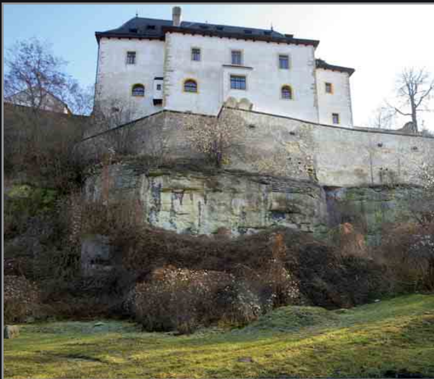
■ Budova paláce Templ (jejímž předchůdcem údajně byla komenda templářů) v Mladé Boleslavi je dodnes součástí starého městského opevnění.