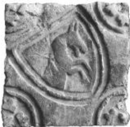
5. Znak Arnošta z Pardubic, gotický kachel z biskupského paláce na Malé Straně v Praze.

První doklady o Arnoštovi z Pardubic ho tedy spojují s Janem Lucemburským; všechna dosavadní literatura s naprostou samozřejmostí váže jeho vzestup na Karla IV. Přispěl k tomu jistě budoucí časový souběh působení obou mužů a jejich pozdější shoda a spolupráce, ale také jistá tradiční nechuť české historiografie ke králi Janovi. V letech 1338–1339 byl dosud králem Jan, byl to on, kdo byl při kurii dobře znám, kdo jako král korespondoval s papežem a vedl tu četná diplomatická jednání. Ostatně byl snad Arnoštův otec kdysi „zaměstnancem“ krále Jana a i to mohlo u něj mluvit ve prospěch syna. Arnošt se kolem roku 1333 opravdu mohl v Itálii, v době pokusu o Janovu severoitalskou signorii, setkat jak s Janem tak s Karlem Lucemburskými, ale nevíme o tom naprosto nic