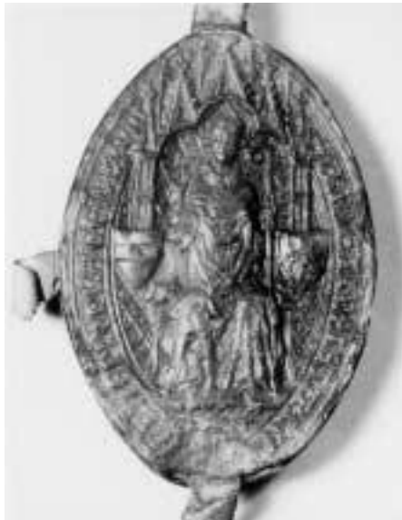
6. Velká pečeť, kterou Arnošt z Pardubic užíval jako pražský biskup.

Arnošt ve funkci děkana odešel roku 1342 spolu s kanovníkem téže pražské kapituly a levobočkem krále Jana Mikulášem z Lucemburku znovu do Avignonu, tentokrát už plně jako králův vyslanec. Jejich jednání s Klimentem VI. 67 se už asi týkala i důležité věci přípravy budoucího pražského arcibiskupství, jak už k tomu, ještě před odchodem poselstva do Avignonu, byly učiněny první kroky zajištěním budoucí novostavby gotické katedrály. Arnošt už v tu dobu nebyl u kurie neznámým člověkem, ale byl papežským kaplanem 68 a člověkem respektovaným a důvěryhodným natolik, že tu zřejmě byl kolem poloviny roku 1342 jmenován kolektorem papežských desátků. Nedochoval se o tom přímý doklad, ale usuzovat na to dovoluje skutečnost, že během tehdejšího pobytu v Avignonu získal Arnošt na základě supliky obou královských vyslanců, tj. sv. a Mikuláše z Lucemburku, uvolněný kanonikát a prebendu ve Vratislavi,