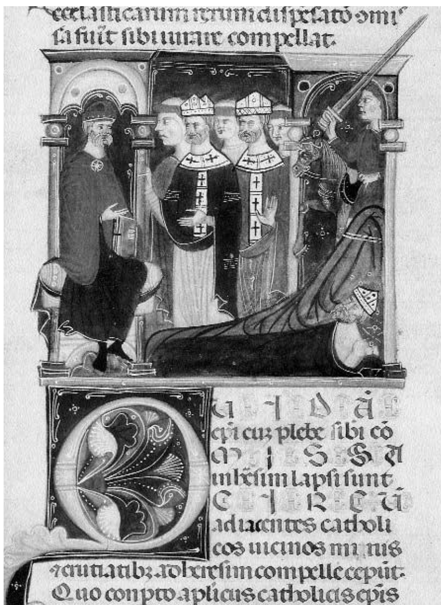
1. Světská moc zasahuje proti biskupům upadnuvším do kacířství. Franciscus Gratianus de Garratoribus, Decretum, Itálie, Bologna, konec 13. stol. Praha, Knihovna Národního Muzea XII A 12, fol. 204r.