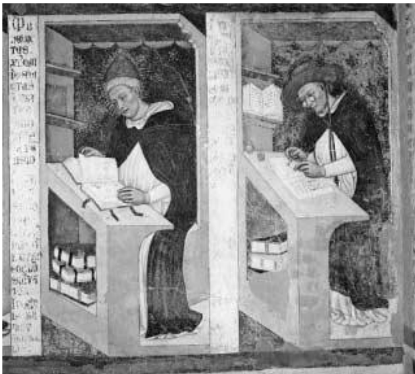
3. Tomaso da Modena, papež Benedikt XI. a kardinál Hugues de St. Cher (Niccolò Bocasini), nástěnná malba v kapitulní síni dominikánského kláštera sv. Mikuláše, Treviso, kolem roku 1340–1350.

měl svůj pevný, na jasném právu spočívající řád již z doby Benediktova předchůdce Jana XXII., 53 k Janovým řádům pro kancelář, rotu a audientii litterarum contradictarum (vše z roku 1331) 54 přidal Benedikt jako poslední ještě řád pro penitenciáři a upravil činnost advokátů a prokurátorů. 55 Přitom hladký chod obrovského kuriálního centra, později zplanělý, byl vytvořen jako podpora pro realizaci církevní reformy sui generis, jíž sloužil a jež spočívala na uplatnění jednotných požadavků do praxe uvedeného kanonického práva a na něm spočívající správy všech kurátních i nekurátních beneficií kdekoliv v latinské Evropě. 56 Později tak neblaze proslulý provizní systém vznikl jako pomůcka pro vytvoření