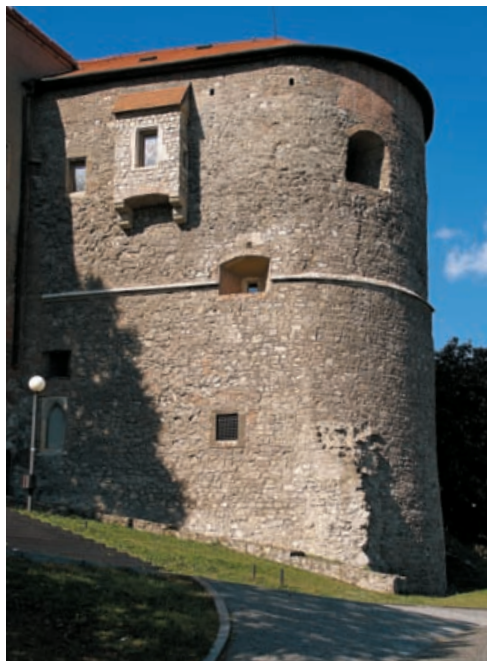
▲ Bašta Lugisland

ternou. Priestor pred palácom zaberá čestné nádvorie (4) ohraničené párom víťazných brán a strážnicami cisárskej gardy. Pri paláci na východnej terase možno vidieť náznakovo rekonštruované zvyšky veľkomoravskej