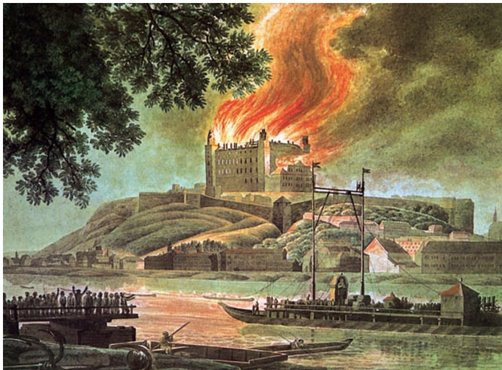
▲ Požiar Hradu v roku 1811

zahraničných intervencií, pohraničná pevnosť spravovaná županom bola raz útočiskom kráľa, inokedy protikráľa a často miestom urputných bojov. Známe je napríklad neúspešné obliehanie nemeckým cisárom Henrichom III. v roku 1052, ktoré spomína aj jedna z povestí.