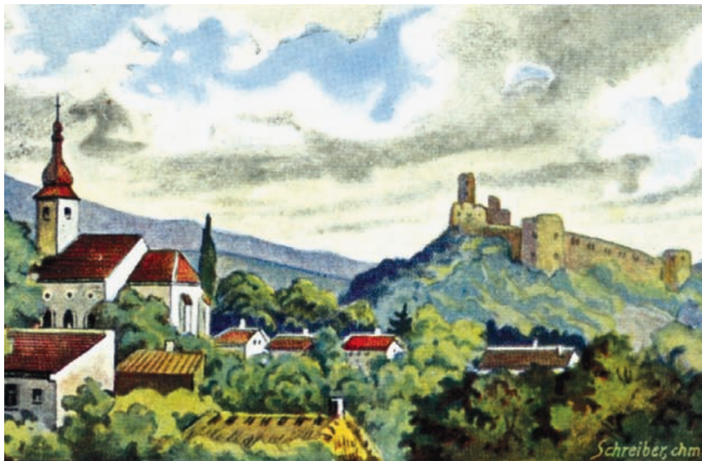
▲ Hrad Smolenice pred prestavbou ▼ Zámocká veža