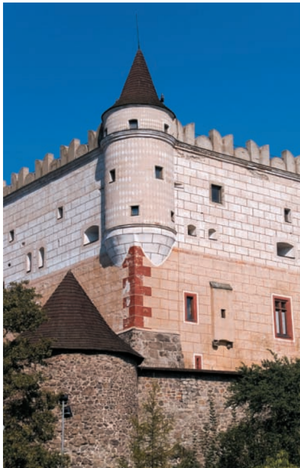
▲ Zvolenský hrad

Keďže sa, napriek istým snahám abstrahovať rozdielny význam pojmu „zámok“ voči označeniu „hrad“ či „kaštieľ“, dosiaľ nikomu nepodarilo preukázať existenciu ďalšieho typologického druhu šľachtického sídla na Slovensku označovaného slovenským výrazom „zámok“, zdá sa, že slovenčina konzervuje dávno zaužívané, resp. prevzaté označenie, ktoré ani pri porovnaní s blízkym zahraničím nemá jednoznačný ekvivalent. Nakoľko túto situáciu ovplyvnili rozdiely medzi západoslovenskými a východoslovenskými nárečiami a nakoľko sa presadili cudzie vplyvy (napr. latinčina), je otázkou pre jazykovedcov. Zdá