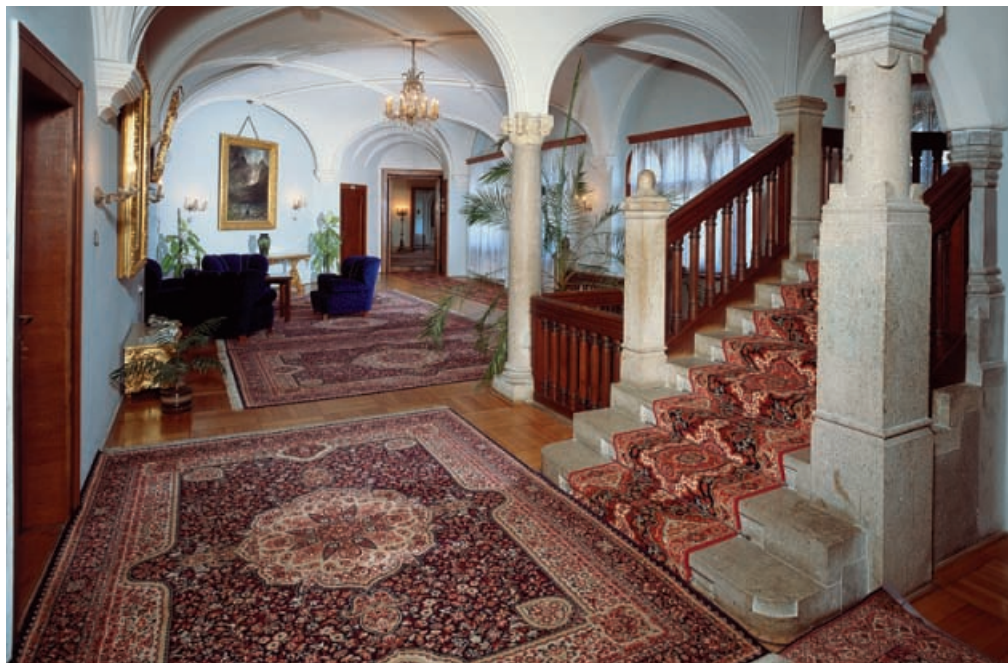
▲ Interiér zámku

azda aj kasteláni, ktorí sa niekedy správali tak svojsky, že sa dostali i do povestí.