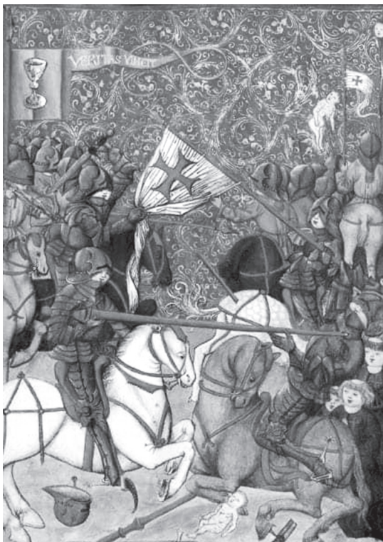
Boj husitů s křižáky, ilustrace z Jenského kodexu