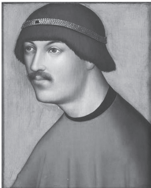
Albrecht II. Habsburský, anonymní portrét z 16. století