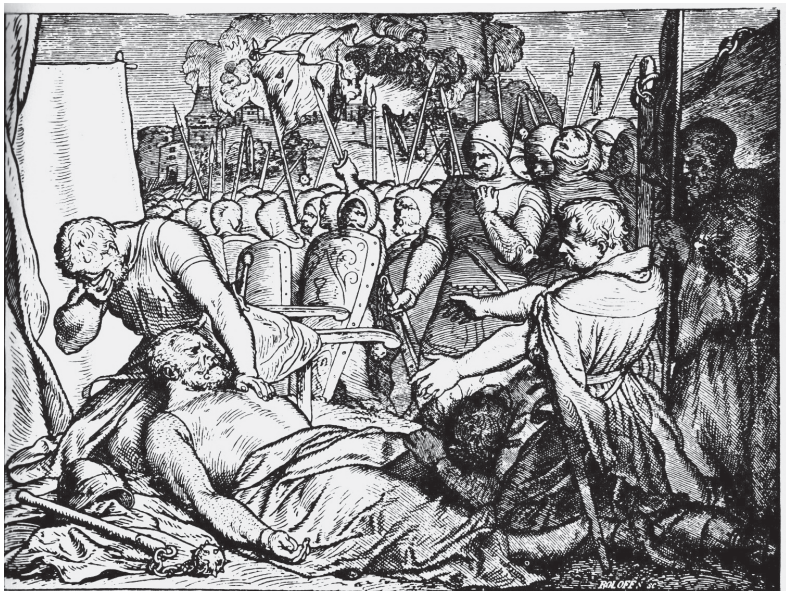
Smrt Jana Žižky u Přibyslavi na kresbě Josefa Mánesa