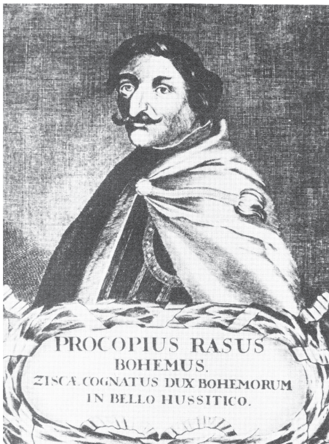
Prokop Holý na vyobrazení z roku 1698

ne s každým. Papež podle Wyclifa musí žít a jednat ve shodě se zákonem božím, tedy Biblií, ale „ nevykonává náměstkovství Kristovo nebo Petrovo, pokud jej nenásleduje ve mravech. “ Wyclif dokonce nepřímou vyzval ke vzpouře. Napsal doslova, že pokud