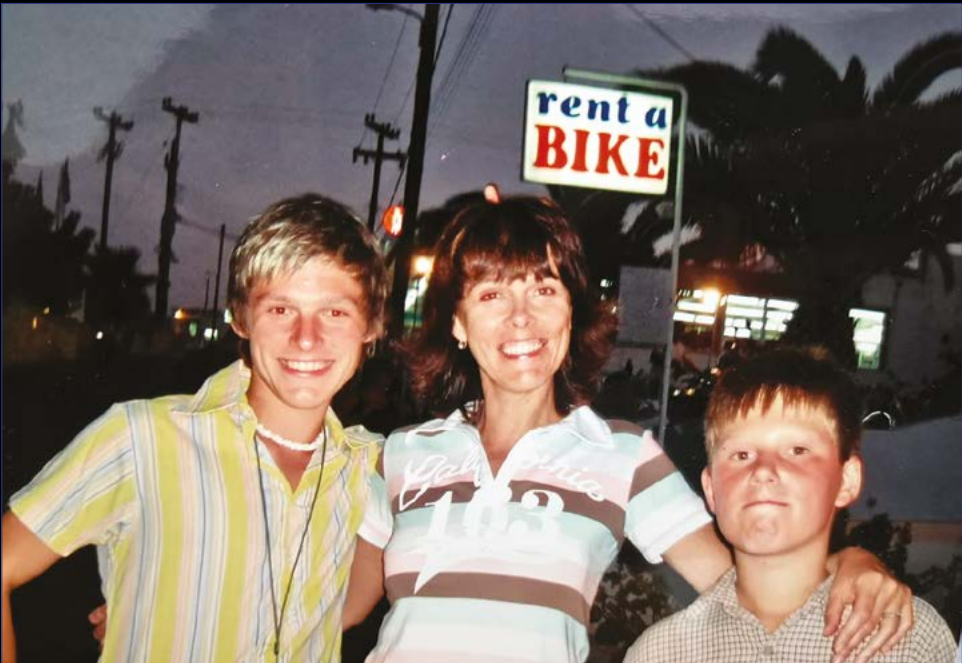
Já, mamka a brácha na dovolené.