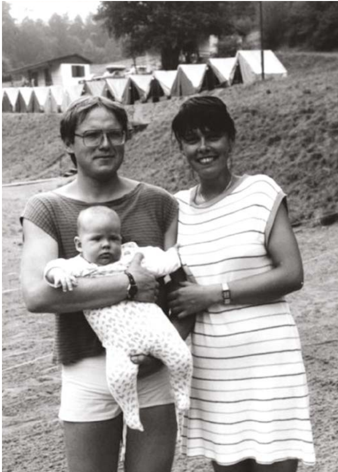
S tátou a mamkou na táboře v Úštěku, rok 1989.