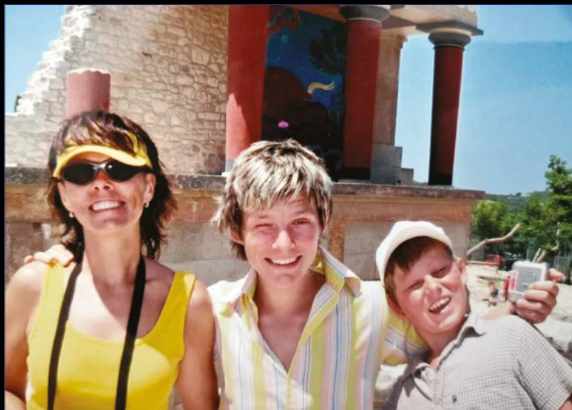
S mamkou a bráchou.