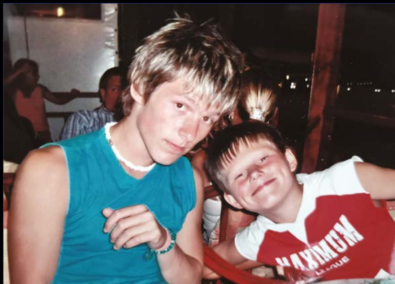
Momentka s bráchou.