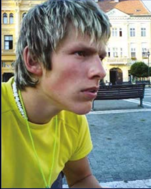
Blondátá éra, když mi bylo šestnáct let.