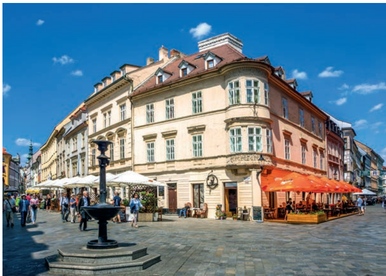
Roh Ventúrskej (vľavo) a Panskej ulice (vpravo)

kamennom múriku sú v tieni zelene skryté busty Geogra Rafaela Donnera (vľavo) a Franza Liszta (vpravo).