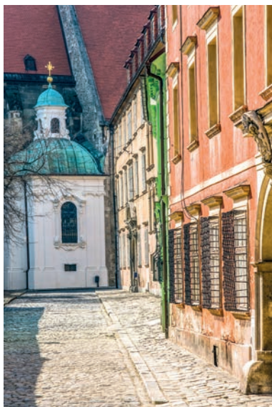
Kaplnka sv. Jána Almužníka

Podchodom cez budovu Univerzitnej knižnice sa dostaneme na Sedlársku ulicu, vedúcu na Hlavné námestie. Historické priestranstvo