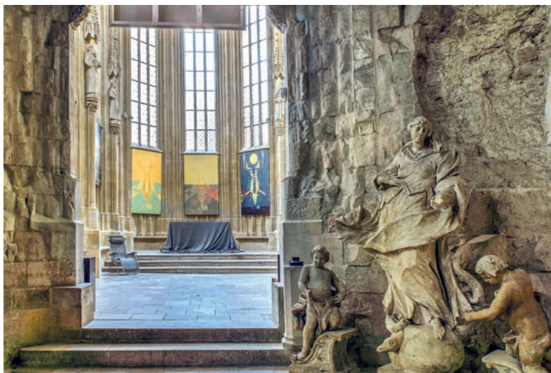
Kaplnka sv. Jána evanjelistu

jeho prehliadky pozrieť slávne bratislavské tapisérie, Zrkadlovú sieň a Kaplnku sv. Ladislava. Nádvorie paláca spájajú priechody s dvomi nádvořiami budov s východmi na Laurinskú ulicu. My sa však vrátíme na Primaciálne námestie, aby sme navštívili na neďalekej Klobučnickej ulici Hummelov dom (21) s expozíciou o slávnom bratislavskom rodákovi, žiakovi zná-