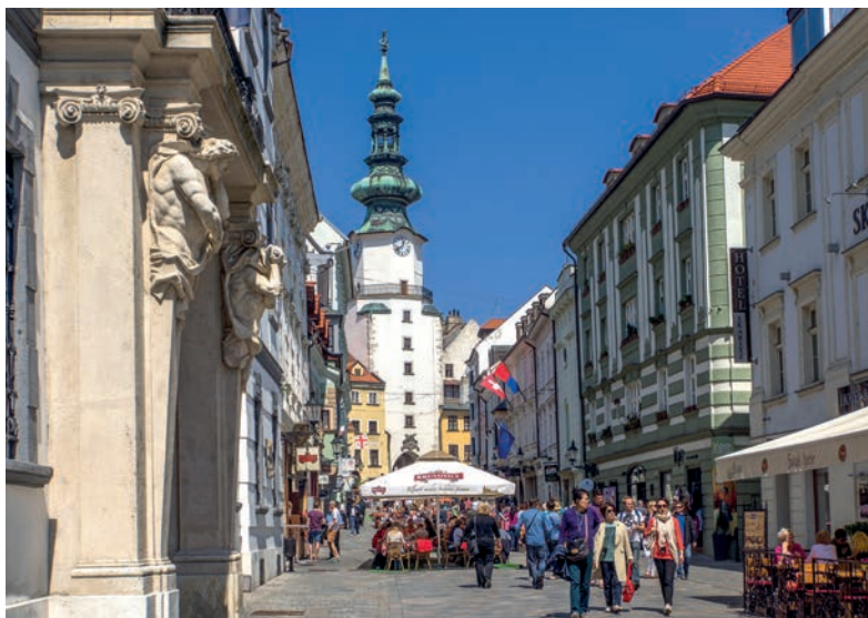
Michalská ulica a Michalská veža

Pôvodné sídlo najvyššej finančnej inštitúcie Uhorska, ako aj susedný Palác Leopolda de Pauli dnes patria Univerzítnej knižnici. Do komplexu moderného kultúrneho centra patrí záhrada s hudobným pavilónom pomenovaným po Franzovi Lisztovi, ktorý tu v roku 1820 koncertoval ako deväťročný malý gényus, čím sa začala jeho hviezdna kariéra.