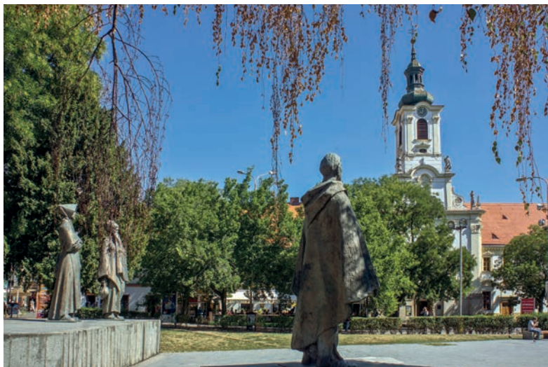
Pamätník SNP a Kostol s kláštorom milosrdných bratov na Námestí SNP

Druhá bratislavská prehliadka nám predstaví najhodnotnejšie pamätihodnosti, ktoré vyrástli okolo historického centra mesta, a zároveň nás zavedie na Bratislavský hrad, kde sa začala písať dlhá a slávna história mesta.