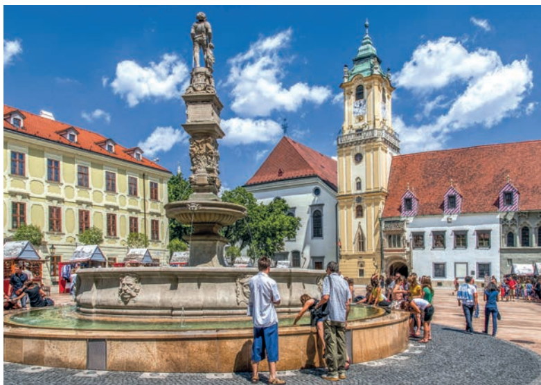
Maximiliánova fontána na Hlavnom námestí

s približne štvorcovým pôdorysom bolo odpradávná centrom diaľnia v meste a takým zostalo až do dnešných čias. Každá z budov námestia je čímsi zaujímavá a z pohľadu od Maximiliánovej fontány (15) v strede námestia si ich postupne predstavíme. V smere hodinových ručičiek postupne vidíme Kutscherfeldov palác, Miestodržiteľský palác, Starú radnicu, dom s vežou (dom č. 2), meštiansky dom, Jeszenákov palác, secesy dom (dom č. 5), Palugyayov palác a Zelený dom. Najväčšiu pozornosť si zaslúži komplex historických budov Starej radnice (16) , v ktorej sú zbierky Múzea mesta Bratislavy venované dejinám mesta. V susednom Apponyho paláci nájdeme expozíciu o vinohradníctve a historických interiéroch. Nevynechajme ani famózný výhľad z ochodze radničnej veže.