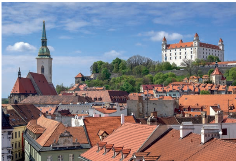
Bratislavské dominanty z radničnej veže

Prvá z dvoch bratislavských prechádzok nám predstaví historické centrum slovenskej metropoly, ktoré v stredoveku vytýčil prstenec mestských hradieb. Na trase vedúcej malebnými ulicami a námestiami postupne objavíme veľké množstvo kostolov a kláštorov, ako aj elegantných mestských palácov, ktoré pamätajú ešte zlaté časy panovania Márie Terézie.