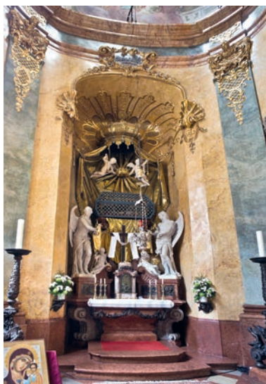
Interiér Kaplnky sv. Jána Almužníka

1563 až 1830. História korunovačného kostola zdôrazňuje pozlátená replika uhorskej kráľovskej koruny na vrchole chrámovej veže. Z barokovej prestavby dómu sa v interiéri zachovalo súsošie sv. Martina od Geogra Rafaela Donnera. Pôvodne bolo súčasťou hlavného oltára, dnes stojí v južnej lodi. Majstrovstvo veľkého rakúskeho sochára môžeme