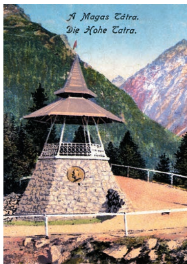
Vyhliadka na Hrebienu v roku 1917

Pod rozhľadňou vo všeobecnosti (i v tejto publikácii) rozumieme len tie objekty, ktoré sú určené pre verejnosť, hoci niekedy v časovom obmedzení alebo za poplatok. Jestvujú rozhľadne prístupné v závislosti na otváracích hodinách areálu, ktorého sú súčasťou, iné si vyžadujú prítomnosť osoby garantujúcej bezpečnosť prevádzky, ďalšie môžu vykazovať rentabilnosť a efektívnosť napríklad len v let-