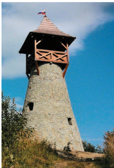
Kamenná rozhľadňa na Bobovci

V tejto publikácii je opísaných 62 rozhľadní a pozorovateľní. Najviac ich je v Žilinskom samosprávnom kraji, najmenej v Trnavskom, Nitrianskom a Bratislavskom samosprávnom kraji. Rekord v počte rozhľadní a pozorovateľní drží okres Michalovce, čestné miesto si získal i okres Čadca. Len tri zo všetkých rozhľadní postavili na najvyšších vrcholoch slovenských pohorí, väčšina je situovaná bližšie k ľuďom a v rekreačných oblastiach. Z deviatich oceľových rozhľadní je najvyššia vyhlíadka na Moste SNP a po nej rozhľadňa na Hradovej. Jedna z oceľových stavieb (na Šachtičke) predstavuje nový, perspektívny trend spájania funkcií telekomunikačných veží s funkciami vyhlíadkových stavieb. Drevených rozhľadní je 39, najvyššou je veža Májka vo Východnej, po nej nasleduje rozhľadňa Poľana, ktorej vyhlíadková plošina je vyššie než vo Východnej. Skutočnosť, že najviac rozhľadní je drevených, je daná nielen tradíciou, ale aj cenovými dôvodmi a menšou náročnosťou výstavby. Najvyššia z piatich železobetónových vyhlíadkových stavieb je na Kamziku a v Duklianskom priesmyku. Najvyššia z deviatich murovaných vyhlíadkových veží je v Šenkviaciach. Niektoré vznikli prebudovaním z vodárne či tzv. „transformátorovne“. Predovšetkým okres Čadca sa môže pochváliť nápaditými a architektonicky zaujímavými kamenými rozhľadňami. Nižšie rozhľadne u nás mierne prevažujú, o to