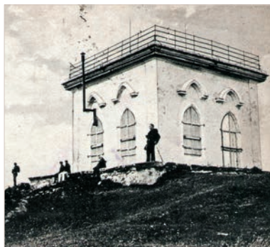
Pavilón na Sitne pred rokom 1918

V dávnejšej minulosti stavali ľudia filagórie – oddychové domčeky, z ktorých bol výhľad na okolie. Ukážkou takýchto objektov je filagória v skanzene v Jahodníckych hájoch pri Martine. Najznámejšou filagóriou u nás sa stala stavba priamo na vrchole Sitna. Vyhladko-