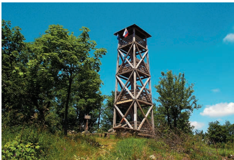
Drevená rozhľadňa na Panskej javorine

Na území Slovenska sa už začiatkom 19. storočia viaceré vrchy opisovali ako bájne. Povesti o Sitne