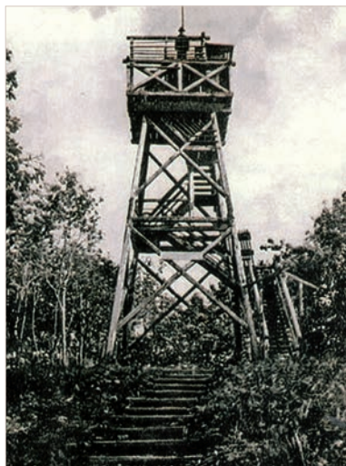
Filipkova rozhľadňa nad Harmóniou okolo roku 1895