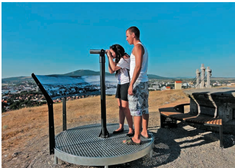
Vyhliadka na kalvárii v Nitre

nom období. Niektoré rozhľadne nemusia byť v zimnom období prístupné z hľadiska bezpečnosti. Finančný príspevok (vstupné) súvisí s celkovou koncepciou ekonomiky výstavby, prevádzky a údržby jednotlivých rozhľadní, bez ohľadu na to, či je majiteľom štátna zložka alebo súkromný investor.