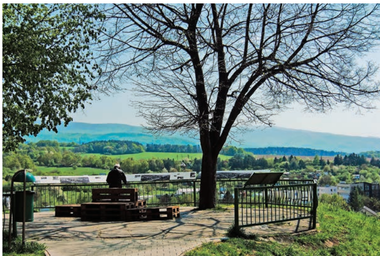
Vyhliadka pri Kostole Nanebovstúpenia Panny Márie v Prievidzi