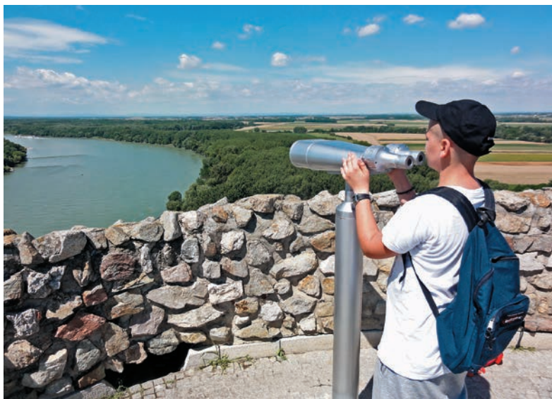
Vyhliadka na hrade Devín

Rozhľadne vznikli na viacerých miestach zmenou pôvodného účelu objektov. Príkladom je Vartovka nad Krupinou, ktorá bola v stredoveku, v obrane proti ťaženiu Turkov, jednou z hlások a pozorovateľní. Po takmer 500 rokoch sa stala rozhľadňou. S podobným zámerom rekonštruovali aj vežu zrúcaniny Kostola sv. Kataríny nad Naháčom. Rozhľadňa pri penzióne vo Veľkom Borovom bola pôvodne trafostanicou a napríklad rozhľadne v Prešove, vo Viglaš-Pstruši a v Šenkviaciach prebudovali z vodárenských veží.