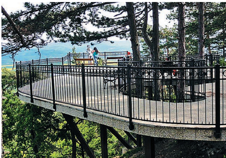
Vyhľadka nad Bojnícami

Postupne začali ľudia využívať na dobrý výhľad aj stavby primárne určené na iné účely. Využívanie kostolných, hradných a zámckých veží na výhľady sa zaznamenalo už dávno, ale rozšírilo sa najmä v ostatných desaťročiach. Pôvodné dispozičné riešenie veží nerátalo s väčšou návštevnosťou osôb obľubujúcich výhľady. Niekde ani stavebná koncepcia veží neumožňovala zabezpečiť pohodlný obojsmerný pohyb osôb po schodoch. Špirálové schodisko obľúbenej Matúsovej veže na Trenčianskom hrade je delené na úseky, na ktorých môže ísť len o jednosmerný pohyb. Vyžaduje sa tu trpezlivosť, disciplína a ohľaduplnosť voči iným. Inak je to v prípade novej kostolnej veže chrámu na Živčákovej. Veža nielenže nesie – tak ako iné veže – zvony, ale má vybudované aj široké schodisko pre tých, ktorí sa chcú pozrieť na Kysuce z väčšej výšky. Na rozdiel od technických dvojúčelových stavieb (napríklad telekomunikačných veží s rozhľadňou) nie je možné kostoly, hrady a zámky s ich vežami umožňujúcimi výhľad nazývať rozhľadňami – s ohľadom na