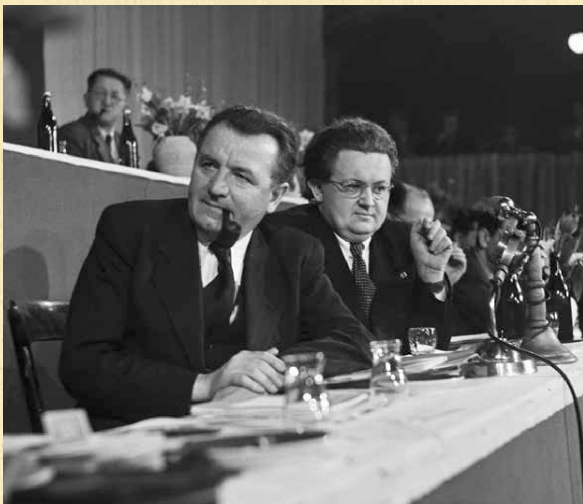
Ikona KSČ. Stranický předák, předseda vlády, protagonista „Vítězného února“ a pozdější „první dělnický prezident“ K. Gottwald s neodmyslitelnou dýmku v ústech. Po jeho levici spisovatel Jan Drda.

Komunisté strany ve východoevropských státech v letech 1945 až 1989 svým občanům tvrdily, že budují prozatím jen „socialistickou společnost“ s konečným cílem její pozdější přestavby na dokonalou beztřídní „komunistickou společnost“. Ta se měla obejít bez peněz, armády, bezpečnosti a dalších nezbytných prvků každé dosavadní lidské společnosti. Součástí komunistických ideálů byla i „světová revoluce“ a vytvoření „světové komunistické republiky“.