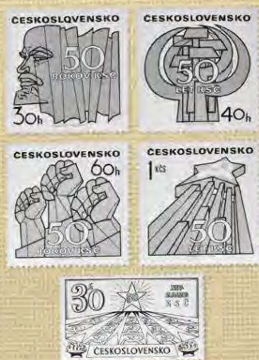
Výroční známky. Arch známek vydaný v roce 1971 k 50. výročí založení KSČ a k opakovanému normalizačnímu 14. sjezdu. Na první známce je podobizna V. I. Lenina.