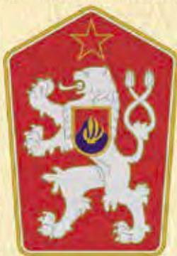
Státní znak Československé socialistické republiky (ČSSR).