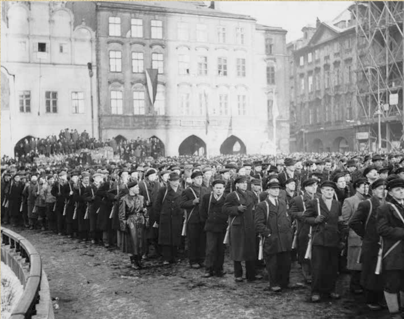
Ozbrojená pěst dělnické třídy. V únorových dnech roku 1948 KSČ iniciovala vznik Lidových milic jako stranické ozbrojené složky. Rozpuštěny byly až po listopadu 1989.

V rámci struktury KSČ fungovaly autonomně slovenské vnitrostranické orgány, včetně vlastního ústředního výboru a Komunistické strany Slovenska (KSS). Naproti tomu české stranické orgány nikdy neexistovaly.