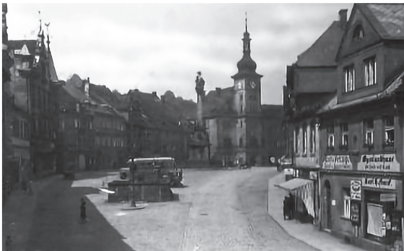
Loket: vpravo dům s knihkupectvím K. H. Franka

Obchody jdou ale špatně. Frank se dostává do dluhů, upomínají jej věřitelé, vyhrožují mu jejich právní zástupci, dochází