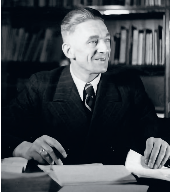
K. H. Frank coby poslanec Národního shromáždění, tedy československý ústavní činitel