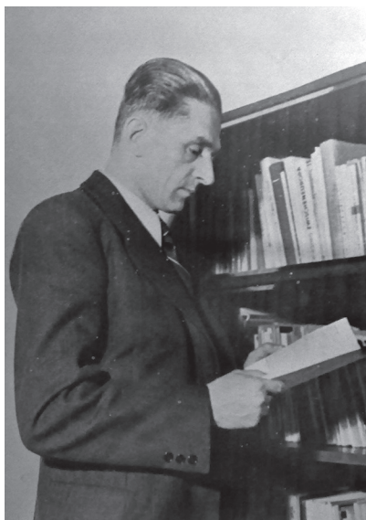
K. H. Frank funkcionářem Sudetoněmecké strany

V polovině února 1934 jsou propuštěni z vazby ti, kdož se na rozdíl od Franka aktivně podíleli na rychlém, ale nelehkém procesu utváření Sudetoněmecké vlastenecké fronty. Ti, kteří byli blízko Henleinovi už dříve a patřili mezi jeho nepostradatelné spolupracovníky v Německém turnerském hnutí.