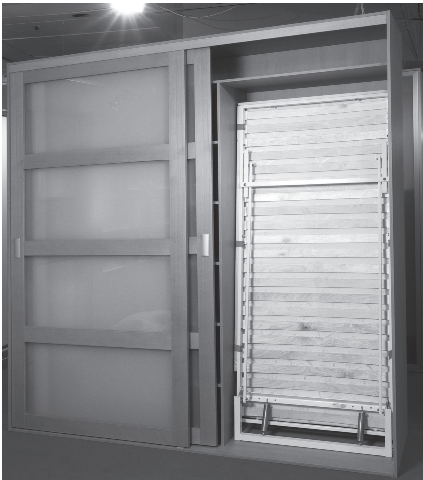
Obr. 2 Za posuvné dveře lze uschovat sklopnou postel nebo malou pracovnu

Před tím, než se pustíme do zařizování interiéru, musíme si uvědomit, jaké jsou naše požadavky na úložné prostory. Nezapomeňme, že další prostor nám zaberou sezónní potřeby nebo sportovní vybavení. Nenechme se zcela strhnout trendy, kde se minimalizuje umístění nábytku v interiéru – objem úložných prostor je zde přemístěný z obytné části zpravidla do vestavěných skříní a šatěn. V úvahu