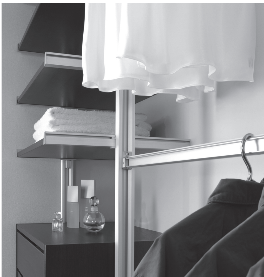
Obr. 7 Šatní systémy

Nedílnou součástí každé skříně a skříňky jsou madla a úchytky. Moderní jsou jednoduchá tyčová v různých délkách, na posuvné dveře se používají vystouplé