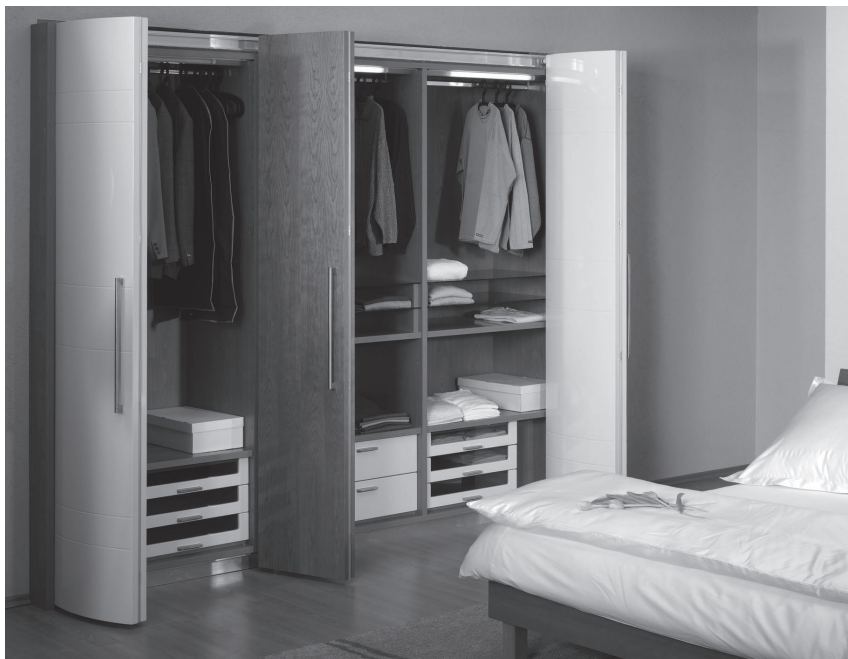
Obr. 3 Odstín vanilkové s třešňovou dýhou je elegantní kombinací

vždy berme velikost našeho bytu. Nevycházejme pouze z kvantitativní potřeby současnosti, vždy počítejme s tím, že některé věci přikoupíme a úložný prostor by měl mít rezervu.