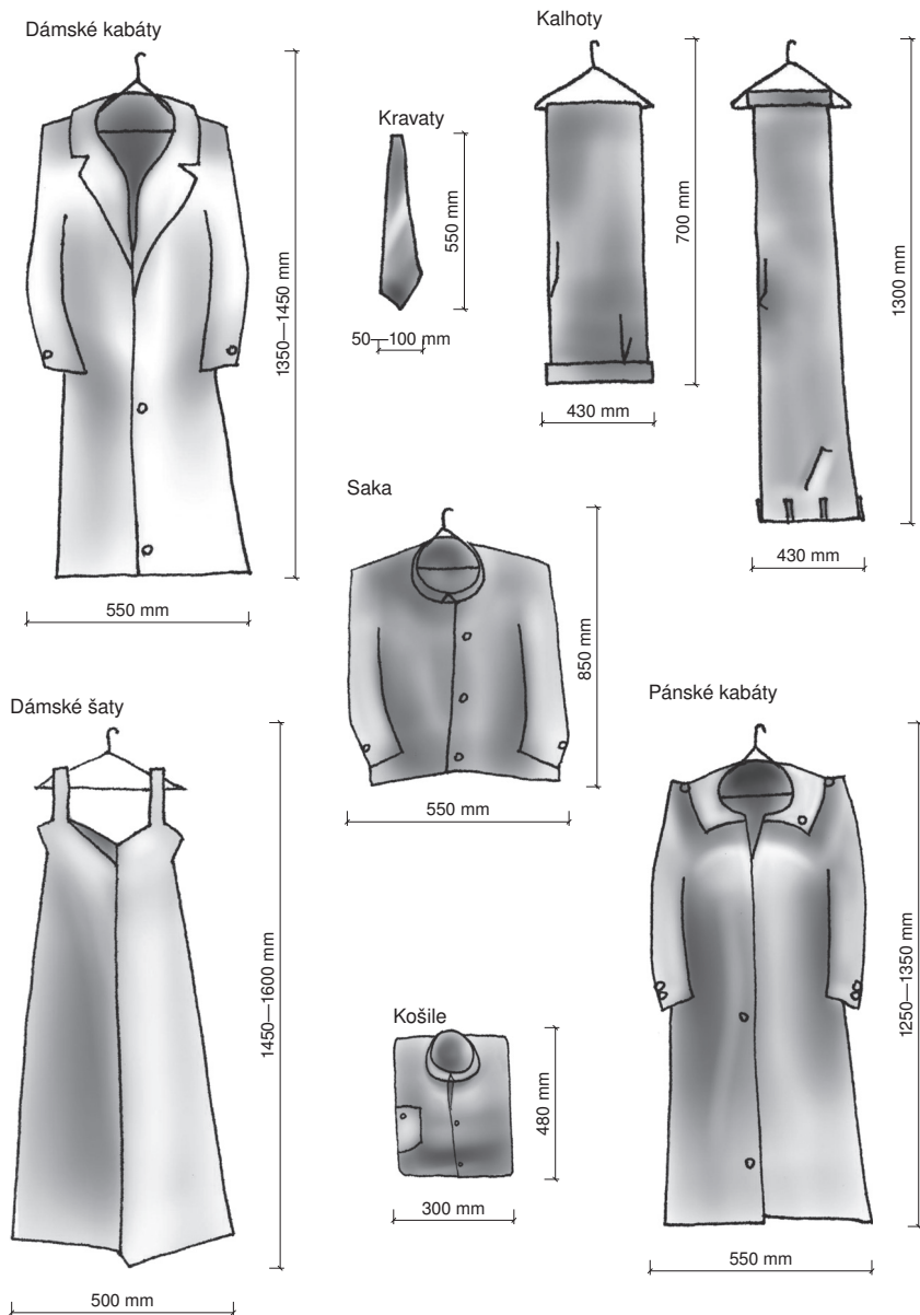
Obr. 5b Obvyklé rozměry nepoužívanějšího oblečení