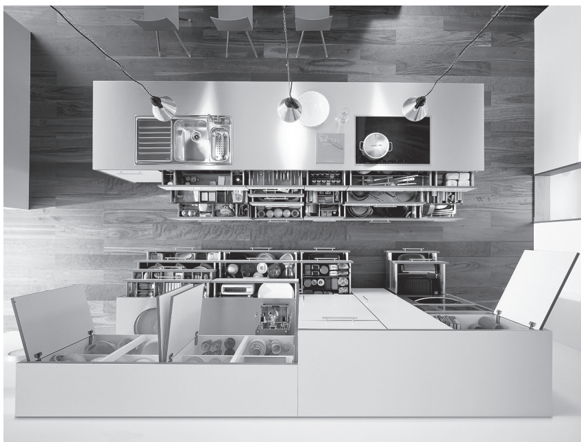
Obr. 4 Ergonomicky řešené úložné prostory v kuchyni