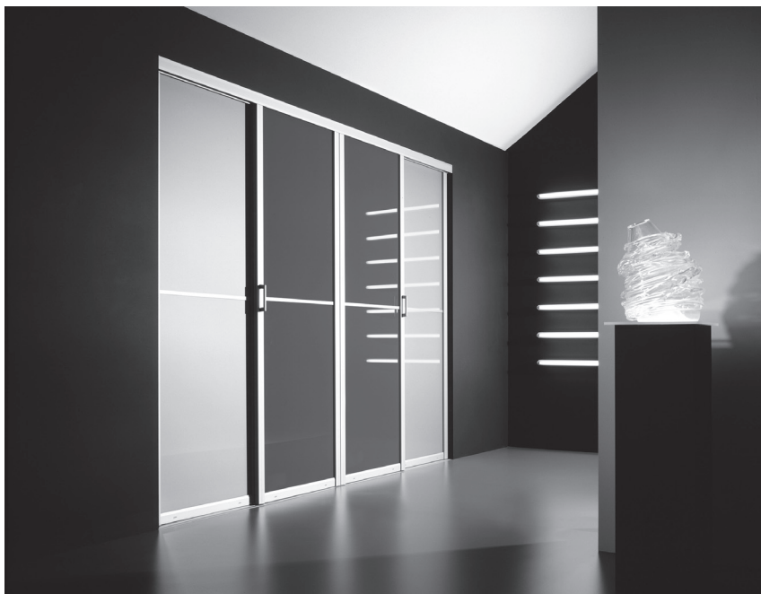
Obr. 1 Kompaktní vestavěná skříň působí v interiéru přirozeně

Během života nashromáždíme velké množství věcí. Neustále dokupujeme nové kusy oblečení, zařizovacích předmětů, hobby potřeb, knih apod. Většina z nás věci hromadí i pro případ, že by se ještě mohly hodit, a proto nic nevyhodí. Místo, abychom věci obměňovali, setkávají se nám mnohdy předměty s letitou patinou s těmi nově koupenými. Nezdívka kdy si koupíme i to, co vlastně vůbec nepotřebujeme. Často ukládáme věci, ke kterým máme citový vztah – hračky z dětství, nádobí po babičce, drobnosti z cest aj. Samostatnou kapitolou jsou dárky, které jsou mnohdy nevhodné, ale z úcty k dárci je pečlivě uschováme.