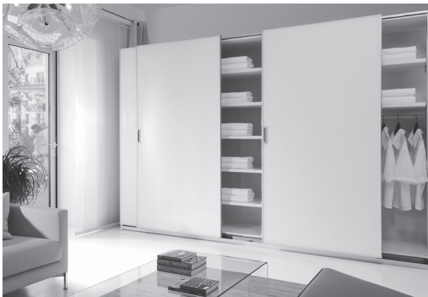
Obr. 6 Objem úložných prostor vždy plánujeme s rezervou

Trendem posledních let jsou podlouhlé formáty členění skříněk. Preferují se široké obdélníkové kontejnery a výklopné skříně. Tento trend je viditelný na komodách, televizních stolcích i velkých skříních. Často se můžeme setkat s členěním vestavných skříní do podlouhlých formátů, mnohdy se jedná pouze o pohledové členění, které se samostatně neotevívá.