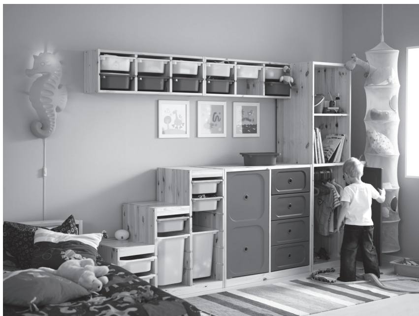
Obr. 8 Systematické uspořádání prostor v dětském pokoji učí dítě pořádku ve svých věcech