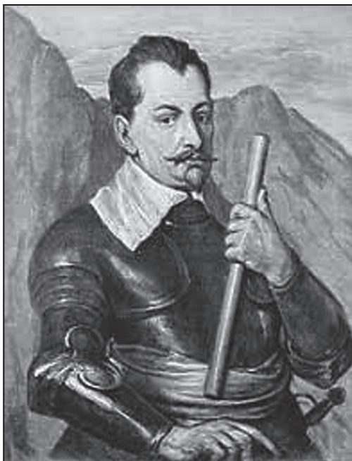
ALBRECHT Z VALDŠTEJNA A JEHO ERB

letí předbíhající dílo bylo rozvráceno. V Jičíně a Frýdlantě zůstalo po svém plánovači reforem a architektu jen několik stavitelských skvostů, dodnes stojí dlouhé rovné aleje vzrostlých topolů a kdysi perfektní cesty, vedoucí odnikud nikam. V Praze němou slávu připomíná skvělý Valdštejnský palác. A to je tak asi všechno.