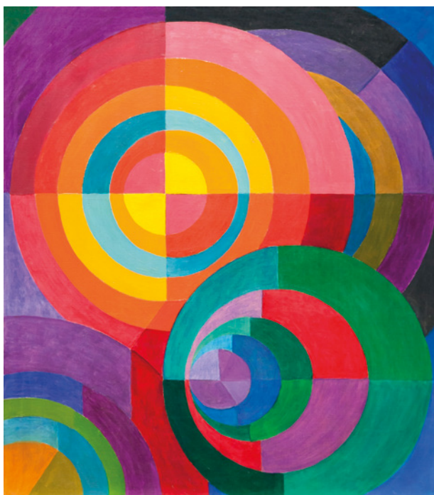
Johannes Itten, Kruhy, 1916, tempera na plátně