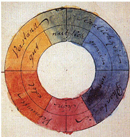
Johann W. Goethe, Zur Farbenlehre, 1810