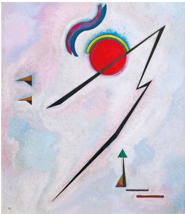
Vasilij Kandinskij, Hranatá linie, 1930, olej na plátně