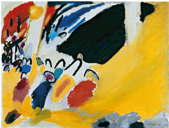
Vasilij Kandinskij, Impresse III (Koncert), 1911, olej na plátně