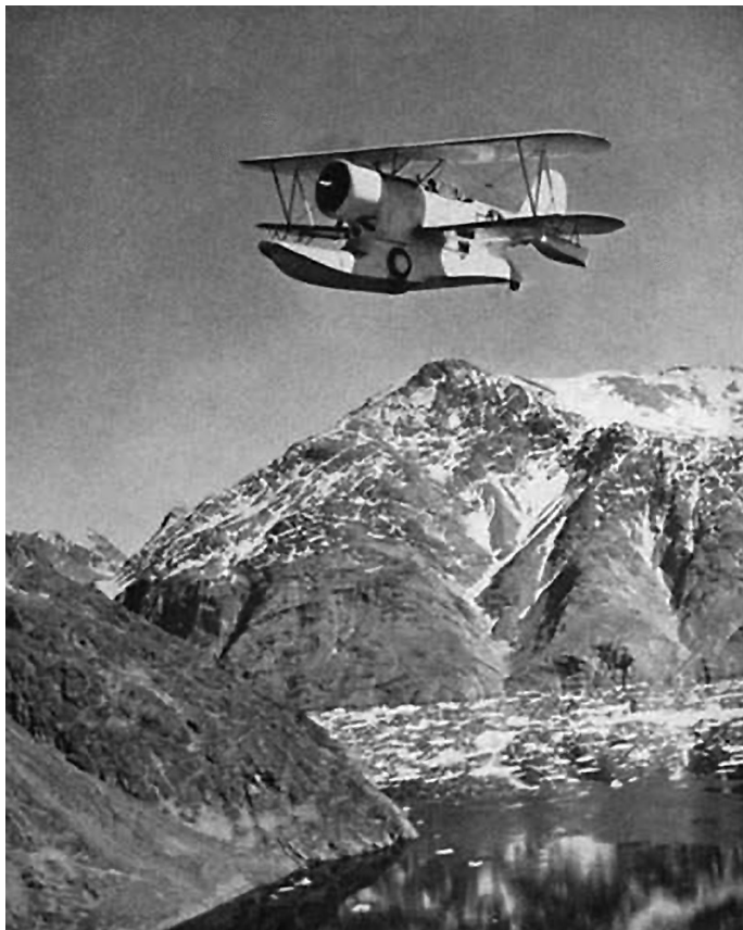
Pozorovací letoun J2F-6 z lodi americké pobřežní stráže Eastwind při hlídce nad grónským pobřežím

Proto tématem našeho dalšího vyprávění nebude v drtivé většině detailní vyprávění o „běžné“ válce v Arktidě – čili o arktických konvojích spojenců do severských přístavů tehdejšího Sovětského svazu, útocích německých ponorek a letadel na ně, pronásledování německých bitevních lodí Bismarck a Prinz Eugen za severním polárním