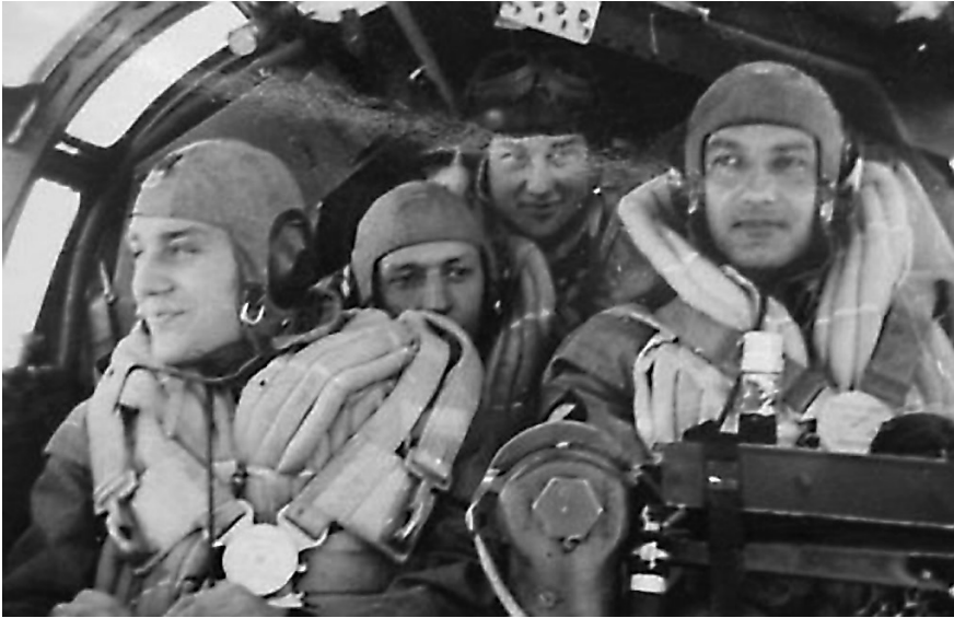
Tři letci a meteorolog – tak vypadaly osádky dálkových německých letounů He-111, které se z norských letišť snažily v arktické oblasti zjistit co nejvíce informací o počasí