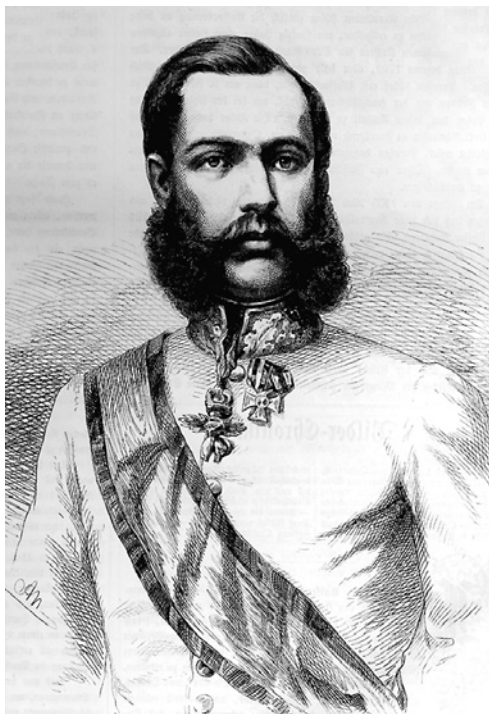
František Josef I.

Jednačtyřicetiletý generál Govone, který se jako čerstvý absolvent vojenské akademie v hodnosti poručíka zúčastnil už první války za sjednocení Itálie a málem byl zabit za války proti Rusku na Krymu, odkud si přivezl jako suvenýr pohlavní chorobu, přijel do Berlína 14. března, přesně v den, kdy rakouská válečná rada zakázala novinám informovat o pohybech vojsk. Dva dny nato se od Bismarcka dozvěděl, že Rakousko rozeslalo členským zemím Německého spolku tajnou nótu s výzvou řešit záležitost polabských knížectví, což Bismarck interpretoval jako porušení smlouvy z Bad Gasteinu. Nedojde-li ve spolkovém parlamentu ve Frankfurtu ohledně Šlesvicka a Holštýnska k dohodě, je třeba počítat i se „spolkovou“ akcí proti Prusku, hrozil rakouský ministr zahraničí hrabě Mensdorff-Pouilly. Bismarck kontroval nótou nastolující