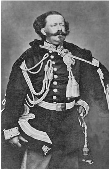
Viktor Emanuel II.

obyvatelé severní části Südtirol mluvili německy a smýšleli rakousky, jejich jižní sousedé z Trentina (Tridentska) hovořili italsky a stejně jako Benátčané tajně věřili, že se jednou probudí jako Italové, jak jim Viktor Emanuel opakovaně sliboval.