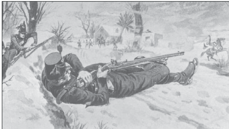
Thomas Plunket mířící na francouzského generála.

chybu, kterou udělal, a naučí se jí opravit. Rekrut se musí nejprve naučit střílet na cíl bez opory, protože pokud by si uvykl od začátku střílet s oporou, nebude schopen střílet na jistotu bez ní, a ačkoli se na první pohled může tento způsob střelby zdát obtížný, pravidelným cvičením bude shledán snadným.*