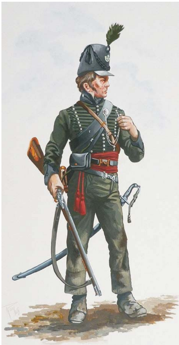
Důstojník 95. pluku ostrostřelců v tradiční uniformě.