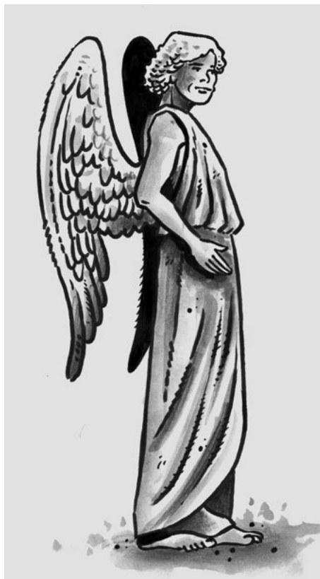
Anděl s křídly v místě těžiště těla

zdořávali všechny překážky a mohli poletovat svobodně a bez zábran vzduchem. Protože se jim nic z toho však nevedlo, nezbylo jim, než aby si takto obdařené bytosti vymysleli a věřili, že jim, lidem, budou naslouchat, pomáhat, poskytovat ochranu a zprostředkovávat spojení s často příliš přísnými až necitelnými bohy.