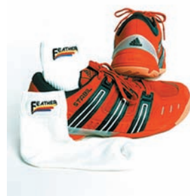
Boty na squash