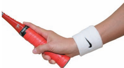
Špatný úchop - ukazováček nedrží rukojeť, je za ni pouze zapřen