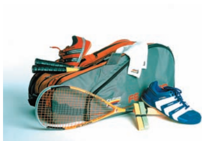
Vybavení na squash

Raketu je třeba si vždy vyzkoušet, každému vyhovují jiné vlastnosti. Musíme se s ní cítit především pohodlně. Vlastnosti, ke kterým bychom měli při koupi přihlédnout, jsou váha, velikost hlavy a vyvážení. Začátečníci, kteří nechtějí utratit hodně peněz, určitě vystačí s levnou (méně kvalitní) raketou. Jak budou více pronikat do hry, zjistí, že kvalitnější raketa vylepšuje komfort a přesnost jejich hry.