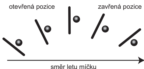
Ovlivnění úderu natočením hlavy rakety

Jedna z možností, jak ovlivňovat samotný úder, je natočení hlavy rakety vzhledem k přední stěně – rozlišujeme otevřenou a zavřenou pozici rakety. Obecně se squash hraje otevřenou raketou – šetříme tak síly a bez větších potíží umísťujeme míček do zadní části kurtu. Zavřená pozice se používá hlavně při útočných úderech.