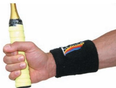
Špatný úchop - kladivovité držení - mezi ukazováčkem a prostředníkem není žádná mezera

Jedna z možností, jak ovlivňovat samotný úder, je natočení hlavy rakety vzhledem k přední stěně – rozlišujeme otevřenou a zavřenou pozici rakety. Obecně se squash hraje otevřenou raketou – šetříme tak síly a bez větších potíží umísťujeme míček do zadní části kurtu. Zavřená pozice se používá hlavně při útočných úderech.