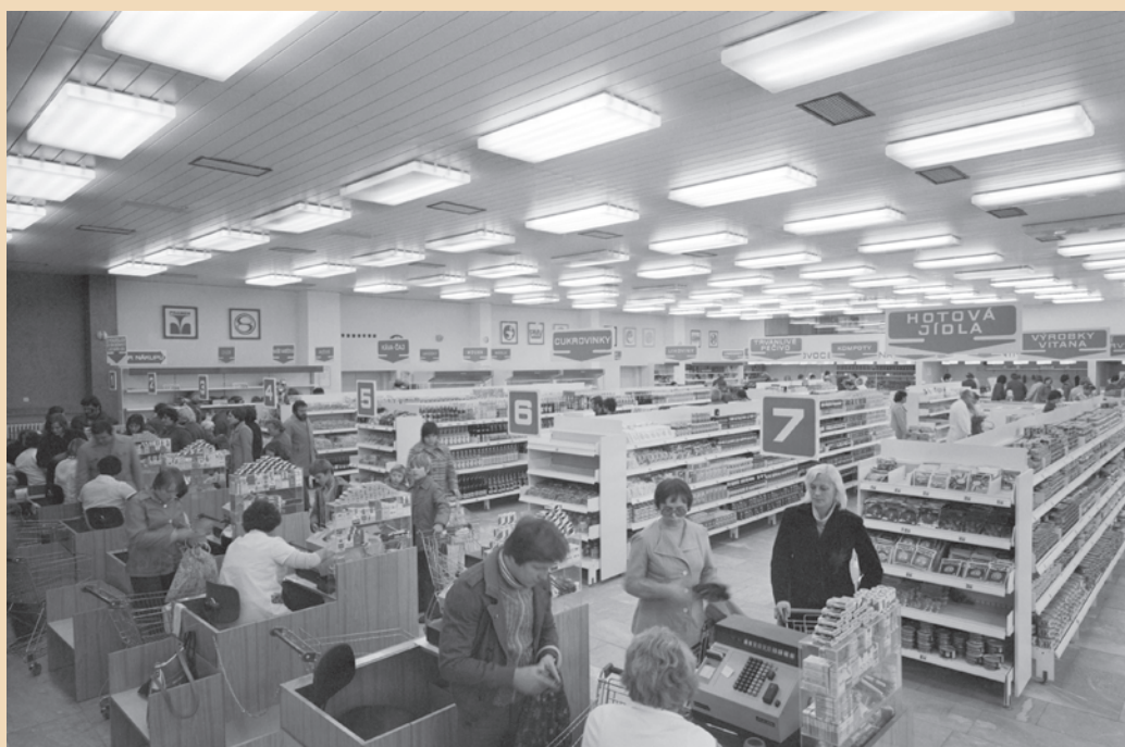
Samoobslužná prodejna Odra v Ostravě Výškovicích.