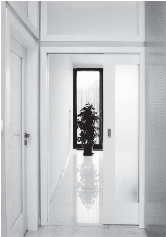
▲ Posuvné dveře zajíždějící do stěny nepřekážejí. Izolují teplo, hluk i pachy.

Posuvné dveře jsou vhodným řešením do malých bytů, neboť jejich křídla si vzájemně nepřekážejí a nebrání v komunikaci. Aby posuvné dveře dokonale těsnily, je potřeba zazdítk do stěny ocelové pouzdro, do něhož se později zavěsí a v němž pojíždějí. Ideální doba pro zazdění pouzdra je tehdy, když se vyměňuje umakartové jádro v panelovém bytě, a všude tam, kde se stavějí nové příčky. Posuvné dveře vně stěny nezajistí dokonalé těsnění a nelze je použít do koupelny a na WC. Výhodou tohoto systému však je, že nevyžaduje speciální stavební úpravy. Instalace se provádí dodatečně po rekonstrukci. Pojíždějící kování –