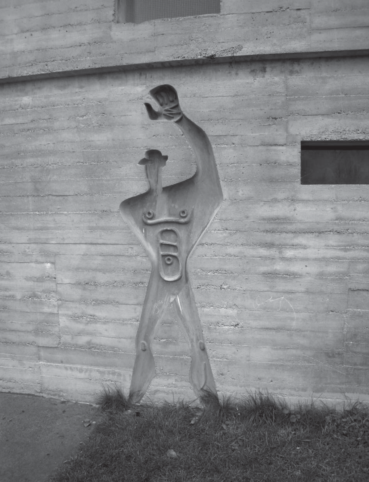
Le Corbusierův Modulor na fasádě Unité d'habitation ve Firminy