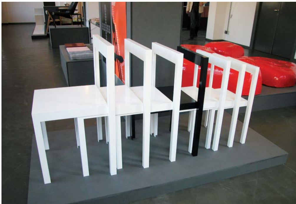
Individuální výrobu je možné provádět pro neomezené množství typů

Růstové a hmotnostní změny populace působí na dimenzování nejrůznějších předmětů denní potřeby (oděvy, obuv, ale i nábytek). Ty jsou v hromadné výrobě navrhovány pro anonymního uživatele, který patří do určité podskupiny jedinců. Snaha výrobce optimalizovat a racionálně standardizovat výrobky musí proto vycházet ze znalosti statistických vlastností tělesných rozměrů předpokládaných uživatelů.