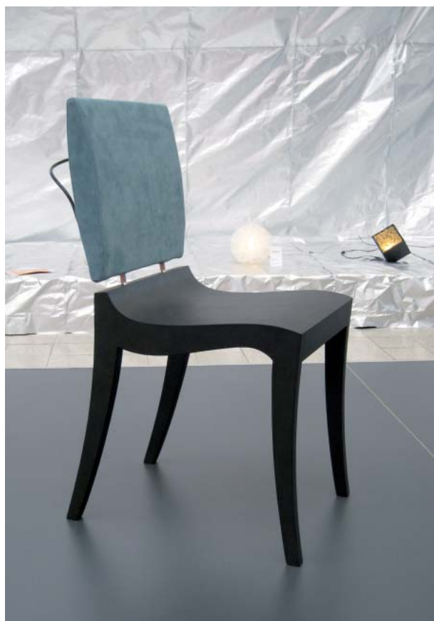
Římskou židli klismos se inspiroval i Thibault Desombre

Rozměry lidského těla se však liší v souvislosti s věkem, rasou, pohlavím, proporčností a někdy dokonce i zaměstnáním. Rozdíl mezi ženou a mužem vycházející z odlišného habitu obojího pohlaví je evidentní. Výškové rozdíly jsou zřejmě ovlivněny stravou a klimatickými podmínkami během dlouholetého vývoje. Obecně lze říct, že jičané v Evropě jsou menšího vzrůstu než severané. V dnešní době globalizace však tento rozdíl oslabuje. Snad nejmarkantnějším faktorem