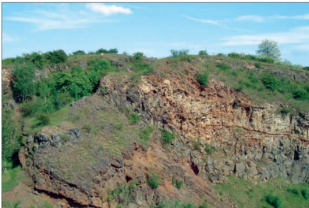
Vrchol Vinařické hory s lomem

LIDICE – pietní území vybudované na místě bývalé obce vyvražděné a zničené nacisty v červnu 1942, vyznačeny základy kostela, školy a Horákova statku, u jehož zdi byli popraveni všichni místní muži, obnovený památník, růžový sad, pozoruhodné sousoší lidických dětí.