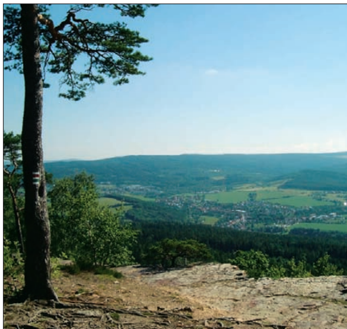
Pohled z Plešivce na Jince

HLUBOŠ – v obci nad údolím Litavky pozdně barokní zámek, který r. 1920 sloužil jako letní sídlo prezidenta T. G. Masaryka, po restituci zpřístupněn veřejnosti.