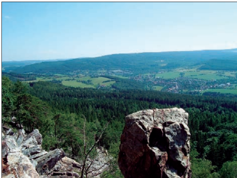
Pohled z Plešivce k jihozápadu

Plešivec je pojmenování dlouhé řady českých kopců, které byly na vrcholu pleché, tedy holé a bezlesé, nebo častěji ploché, protáhlé a zaoblené bez výraznějšího vrcholu. Mezi ty druhé patří i Plešivec, který je naším cílem. Leží ve vrchovině zvané Brdy, přesně tam, kde hluboké údolí říčky Litavky odděluje střední Brdy od pásma zvaného Hřeben. Právě Hřeben Plešivec uzavírá. Je to rebelant a samotář mezi brdskými kopci. Nestojí hezky ukázněně v řadě jako ostatní, ale rovnou kolmo k hřebenu. Právě to kromě nadmořské výšky 654 m způsobuje, že je mimořádně nápadný a zdaleka viditelný.