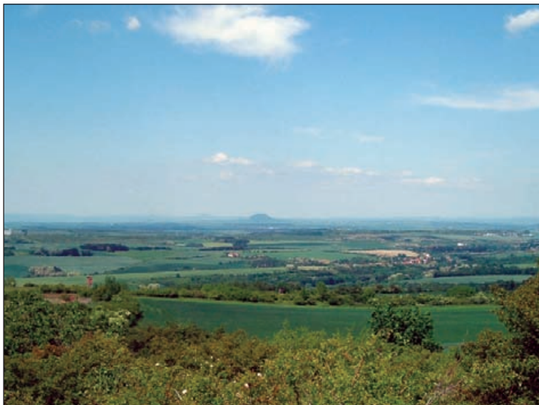
Pohled z Vinařické hory k Řípu

I na turisticky nepřilíh atraktivním Kladensku lze najít obecně známá místa. K nim patří také třetihorní sopka zvaná Vinařická hora. Označení hora je ale pro návrší s nadmořskou výškou 413 m poněkud nadnesené. Na západní straně má sice výraznou a dosti strmou stráň, ale z opačné strany se jeví jen jako malá vyvýšenina mezi poli. Je to však stratovulkán, který je od roku 1985 prohlášen přírodní památkou jako nejlepší ukázka tohoto typu sopky u nás s množ-