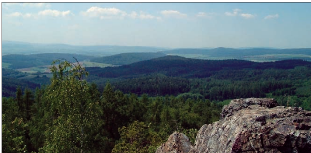
Pohled k západu s Točníkem

KŘIVOKLÁT – nad městysem stejného jména významný královský, původně lovecký hrad s dominantní válcovou věží v pozdně gotické podobě z přelomu 15. a 16. století, oblíbený výletní cíl.