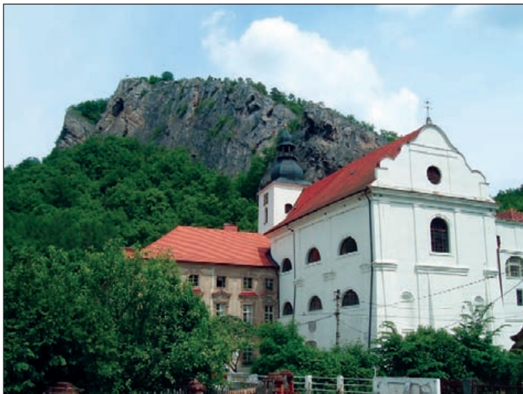
Svatý Jan pod Skalou – klášter

Naším cílem však není toto pozoruhodné místo, nýbrž vrchol skalní stěny nad ním. Říká se mu prostě Skála a je to výběžek vápencového hřbetu Stydlé vody, jehož západní stěna se tyčí přímo nad klášterními budovami. Na vrcholu Skály (438 m n. m.) je vyhlídkový bod zabezpečený jen starým krátkým železným zábradlím kolem dřevěného kříže, zdejší vyhlídka však nemá v oblasti Českého krasu konkurenci, i když nejde zrovna o výhled do daleka. Je to spíše