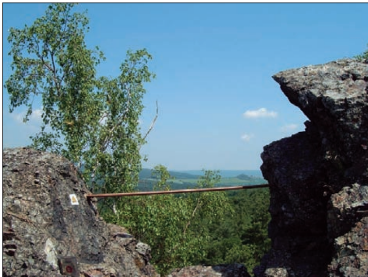
Vrchol Vraní skály s Hudlickou skalkou