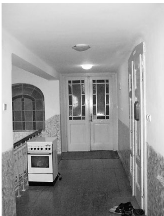
Za těmito dveřmi měli Henleinovi byt.

V německy psané Historii města Rychnova od 1. ledna 1901, sestavené kronikářem Wilhelmem Preisslerem na základě obecních protokolů, církevních knih a dalších pramenů, se lze dočíst ohledně roku 1914: „Toto zasedání městského zastupitelstva z 26. února 1914 bylo poslední, jež vedl starosta Anton Hübner. Poté, co vyšla na světlo denní ta skutečnost, že pan Hübner hrál ve věci zabeďnění hnojiště Antona Peukerta dvojí roli, když jako starosta nejdříve zabeďnění hnojiště nařídil a potom pro Antona Peukerta vlastní rukou odvolání proti svému vlastnímu rozhodnutí sepsal, nebylo možné, aby dále zaujímal čestné postavení