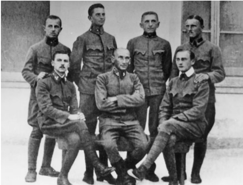
V zajateckém táboře (stojící druhý zleva).

se a koupat. [...] Po večeri tak ještě hodinu studuji, následuje cvičení na bradlech a šerm fleretem, a to třikrát týdně. Jsem předcvičovatelem prvního družstva a z mých žáků se stali skvělí turneři. Šermu mě učí jeden šermířský mistr z Vídně.“