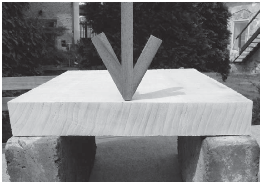
Obr. 1 Nejmenší pevnost

Pomůže vám to mimo jiné k pochopení pevnosti dřeva. Vidíte v krajině vysoký strom, jak se kymácí v prudkém větru a jen málokterý se zlomí. Takže v podélném směru je dřevo nejpevnější (viz obr. 1 a 2).