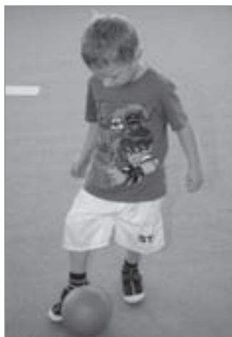
Vedení míče vnitřní stranou nohy