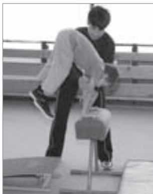
Dopomoc při naskoku na kozu

V pozici vedle kozy (švédské bedny) uchopíme dítě jednou rukou za paži a druhou rukou nad zápěstím.