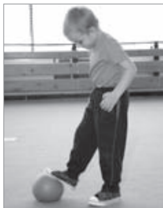
Zastavení míče nohou

Podsazená pánev, správná poloha trupu, ramena stažená směrem dolů k pánvi, hlava vytažená v prodloužení páteře, kolena o něco níže než kyčle, osy kolen směřují k palcům na noze (klouby dolních končetin v jedné ose – kyčel, koleno, palec), celá chodidla na zemi.