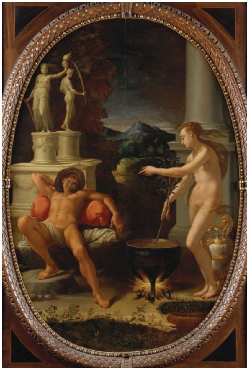
Médea a lásón od florentského maliře Girolama Macchiettiho, cca 1570–75