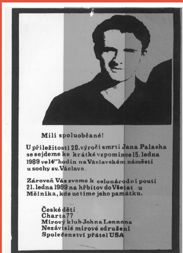
Pozvánka na pietní vzpomínku na Jana Palacha