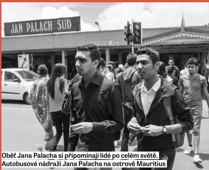
Oběť Jana Palacha si připomínají lidé po celém světě. Autobusové nádraží Jana Palacha na ostrově Mauritius