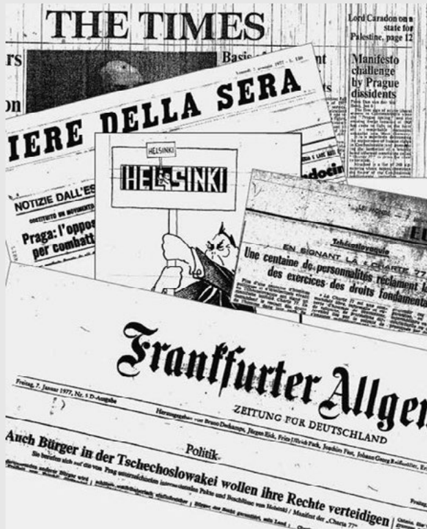
Charta 77 ve světovém tisku, leden 1977