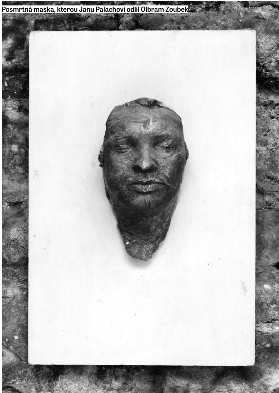
Posmrtná maska, kterou Janu Palachovi odlil Olbram Zoubek

pod ní prst. „Tak to bylo takové zadostiučnění,“ komentuje to dnes Olbram Zoubek, který vytvořil také pamětní desku Jana Palacha nyní umístěnou na Filozofické fakultě Univerzity Karlovy.