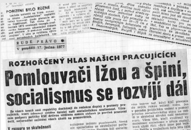
Komunistický režim na Chartu 77 zareagoval okamžitě pomlouvačnou kampaní