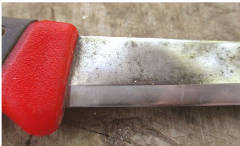
Nůž s jednoduchou plochou čepelí (neboli se skandinávským ostřím).

Čepel nože může být vyrobena z karbonové nebo nerezové oceli, ale u projektů v této knize to nehraje důležitou roli. Abych to zjednodušil, nerezová ocel je odolnější proti vlhkosti a pravděpodobně nezrezne.