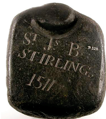
Curlingový kámen ze Stirlingu z roku 1511