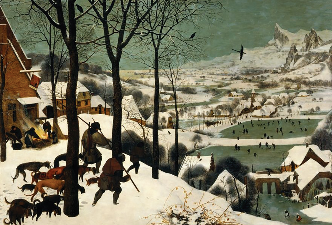
Obraz vlámského malíře Pietera Breugela staršího z roku 1565 Lovci ve sněhu zachycuje hráče curlingu

na americkém kontinentu The Royal Montreal Curling Club, který byl rovněž prvním sportovním klubem vůbec založeným na západ od Evropy. Respektovaným sportovním odvětvím je curling nejen v Kanadě a ve Skotsku, ale rovněž v USA, Švýcarsku a skandinávských zemích. V kontinentální Evropě se curling poprvé objevuje začátkem devatenáctého století. První klub vznikl v Bavorsku a ve stejném roce vznikají první kluby ve Švýcarsku, kde se jeho centrem stává kolem roku 1880 Svatý Mořic. Konkrétnější organizační formu však curling dostává až v první polovině devatenáctého století založením entity s názvem Grand Curling Club. Dramatický rozvoj prožívá v posled-