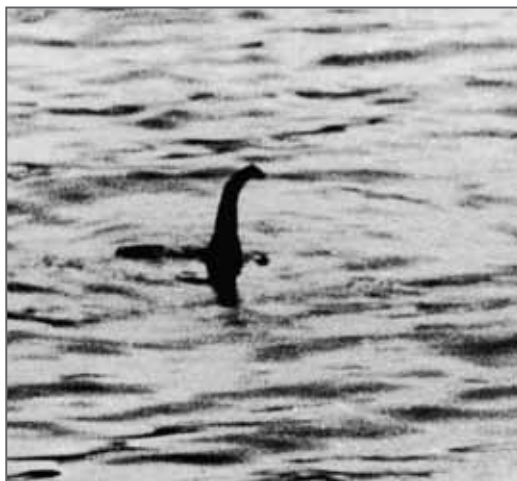
První fotografie lochneské příšery rozpoutala současnou lochneskou mánii.

Navzdory tomu, že spatření lochnesky ohlásilo přes tři tisíce jednotlivců, příšera jako by se ostýchala ukázat vědeckovýzkumným týmům. První rozsáhlou expedici uspořádala počátkem sedmdesátých let minulého století Akademie aplikovaných věd z Bostonu ve státě Massachusetts. Vybavena vodotěsnými fotoaparáty pro potápěče a ultrazvukovými lokátory pořídila snímky čehosi, co vypadalo jako dvouapůlmetrová ploutev a neobvyklé šestimetrové tělo uzpůsobené k životu ve vodě, a dokonce nezřetelnou fotku tváře. Avšak organizované hloubkové prozkoumání jezera sonarem v roce 1987, označené Operation Deepscan , odhalilo, že dříve pořízený snímek nezachytil nestvůru, ale pařez. Kromě toho sonar reagoval na různé neobjasněné předměty pohybující se ve velké hloubce.